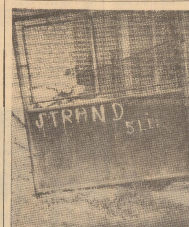
E bine că măcar prețul de intrare la strandul din Aeroport — Petrosani a fost stabilit deja...