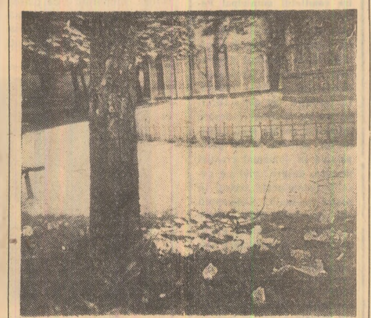
O „mostră” a unei dintre „insulele” de resturi menajere aflate pe „covoarele” de iarbă ale parcului din Petrița.