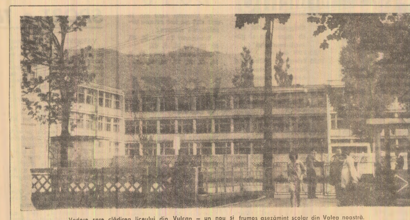
Vedere spre clădirea liceului din Vulcan — un nou și frumos aşezămint şcolar din Valea noastră.