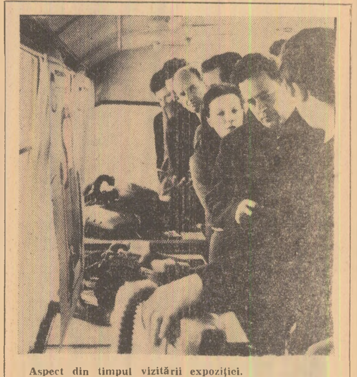
Aspect din timpul vizitării expoziției.

Convorbirea, care a durat o oră și douăzeci de minute, s-a desfășurat într-o atmosferă deosebit de cordială.