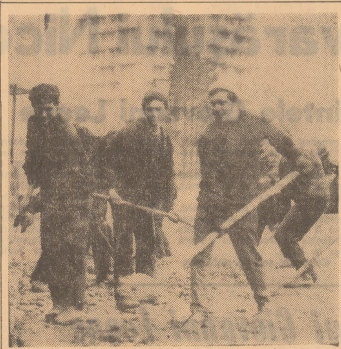
În fața intrării secției nr. 44 — Auto-moto aparținînd cooperativei „Unirea” din Petrosani tinerii muncitori au ieșit la muncă patriotic pentru amenajarea gardului care va împrejmuia secția. De acum încolo, fațada acestei secții de pe strada Republicii va avea și ea o față mai demnă...