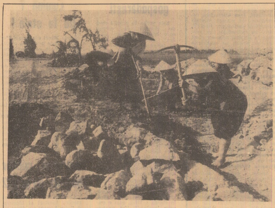
R. D. VIETNAM. Imagine de pe unul din numeroasele șantiere din regiunea Vinh Linh.