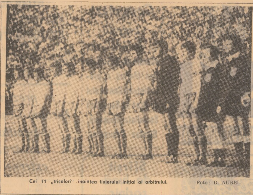
Cei 11 „tricolori” înaintea fluierului inițial al arbitrilor.

Plăcută și relativ simplă este misiunea cronicarului, după un meci de fotbal ca cel de duminică, dintre România și R.D. Germana, câștigat după cum se știe de către „tricolori” cu scorul de 1-0. Plăcută prin rezultate, prin desăvârșirea în sine a jocului, care a demonstrat o destul de neașteptată superioritate de ansamblu a „naționalei” noastre, plăcută în fine prin perspectivele certe ce le deschide „team”-ul românesc de a ajunge pentru a doua oară consecutiv în turneul final al campionatului mondial de fotbal!