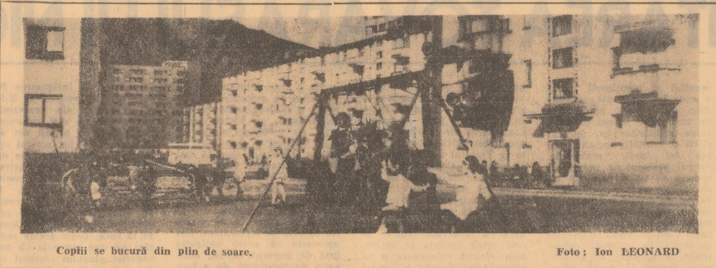
Copiii se bucură din plin de soare.