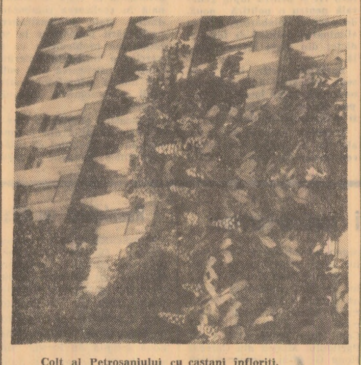
Colț al Petroșaniului cu castani înfloriți.