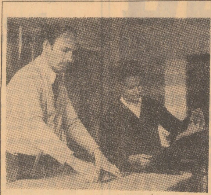
„Oamenii, în primul rind, trebuie să fie... oameni. Dacă semnul tău, clientul în cazul nostru, nu te simte alături, nu sesizează că vrei să-l mulțumești, spre a te ști... amic, atunci fi sigur că, pe undeva, ai greșit...”