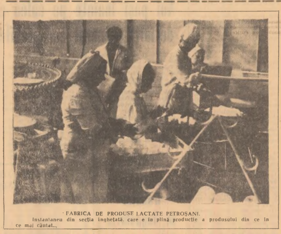
FABRICA DE PRODUSE LACTATE PETROȘANI. Instantaneu din secția înghețată, care e în plină producție a produsului din ce în ce mai căutat...

Hotărîți să acorde un sprijin substanțial pentru îmbunătățirea aprovizionării cu apă a populației din Petroșani, sub îndrumarea comitetului U.T.C., s-a condus acțiune, alți tineri u-teciști de la liceul industrial minier vor ieși la muncă patriotică în zilele următoare.