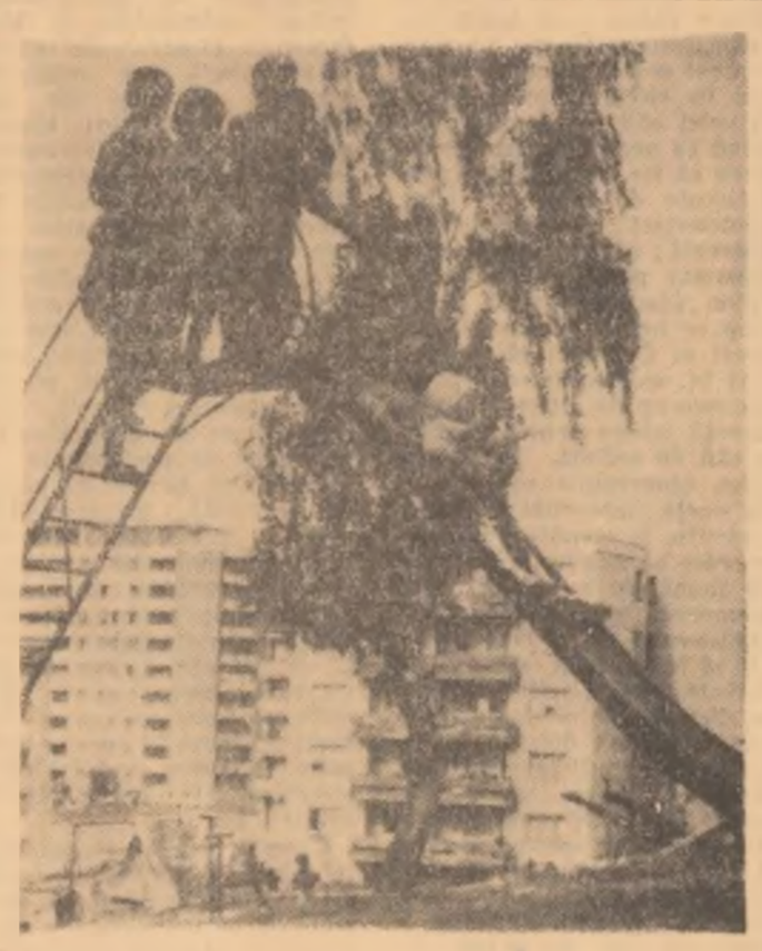
Cîtă bucurie simt acești copii. Cînd pe tobogan, alunecă zglobii!