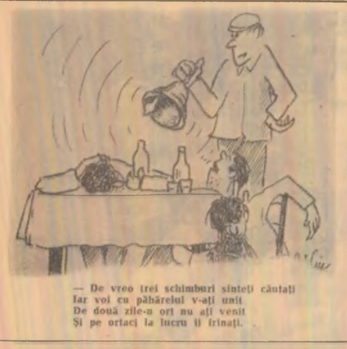
— De vreo trei schimburi sintei cîntăci iar voi cu pahărelul v-ați unit. De două zile-a ort nu ați venit. Și pe ortaci la lucru îi frînați.