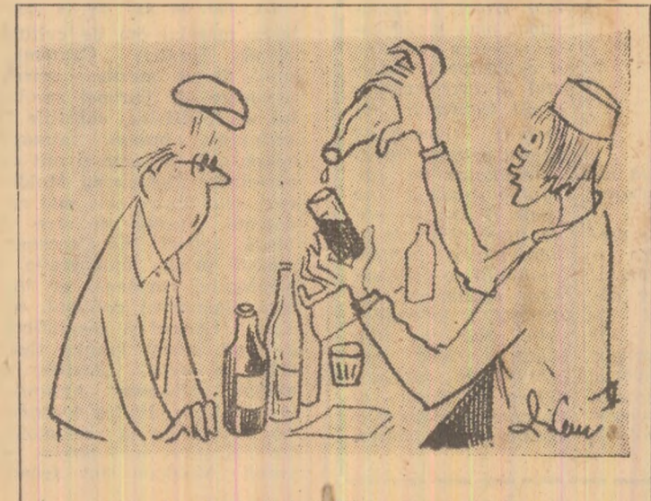
— Asta da, dexteritate! Să muți orizontală...!

În unele localuri de alimentație publică: Unități de măsură uitate: CINSTEA ȘI CORECTITUDINEA