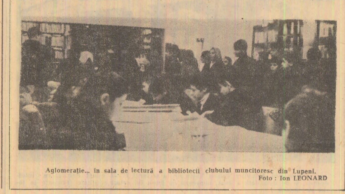
Aglomerație... în sala de lectură a bibliotecii clubului muncitoresc din Lupeni.