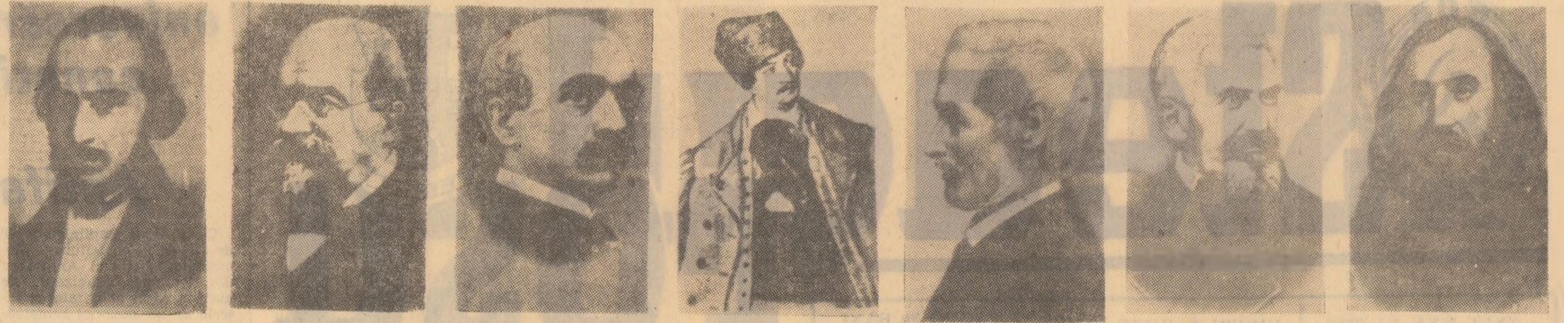
Nicolae Bălcescu Mihail Kogălniceanu Vasile Alecsandri Avram Iancu George Barițiu Timotei Cipariu Eftimie Murgu

(Din cuvîntarea tovarășului NICOLAE CEAUȘESCU la adunarea populară de la Blaj din 17 mai 1973).