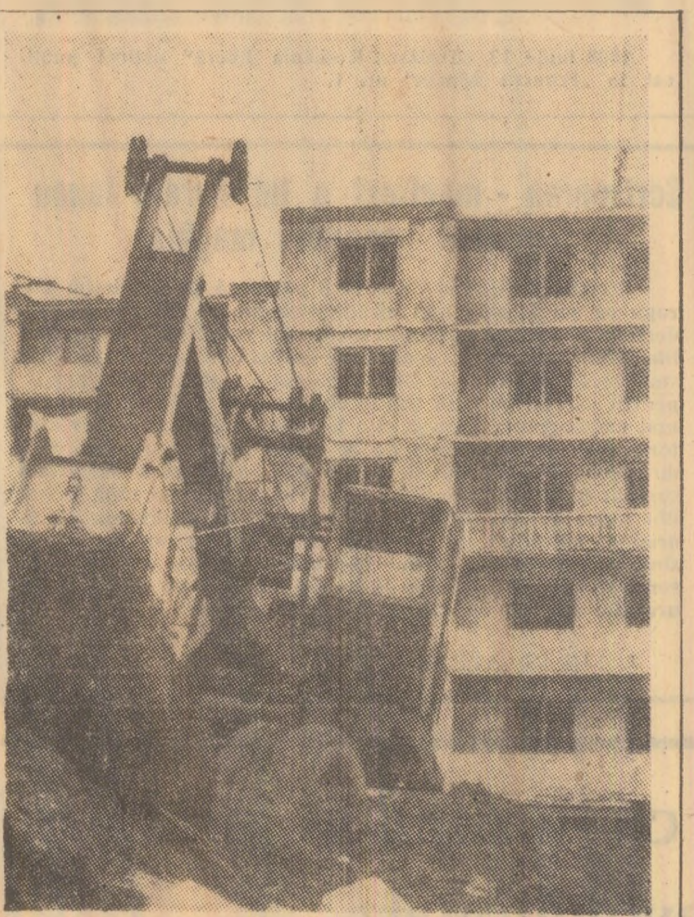
Se „sapă” fundația unui nou bloc de locuințe în cartierul Coroșești - Vulcan.

Pe de altă parte, fiind scema de posibilitățile de care dispune industria locală a obținut suplimentar comenzi la export pentru însemnate cantități de piese turnate din fontă, hidranți, din care în aceste zile vor fi exportate un prim lot de 3.300 bucăți.