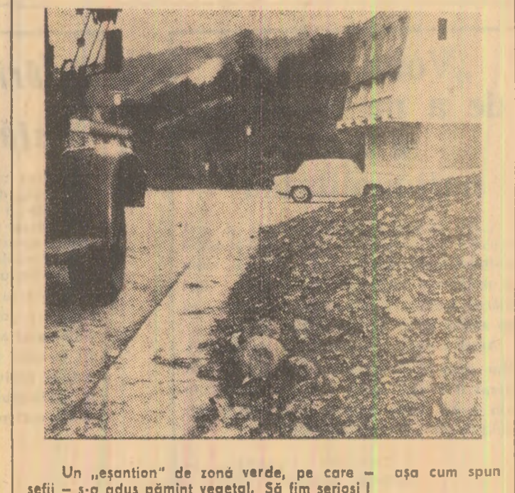
Un „esantion” de zonă verde, pe care — așa cum spun șefii — s-a adus pămînt vegetal. Să fim serioși!

„de-al casei” ești întrebare după ce te saturei de stat ce dorești (în regulile generale de comerț se spune că ospătarul este obligat să-l întinpline pe vizitator, să-l salute politicos, să-l invite să ia loc la o masă pe care să i-o ofere — cînd le vom învîța pe toate acestea) și apoi aștepți să li se aducă comanda ca să vină ospătarul să-ți spună că... nu mai este decît... Și pentru că