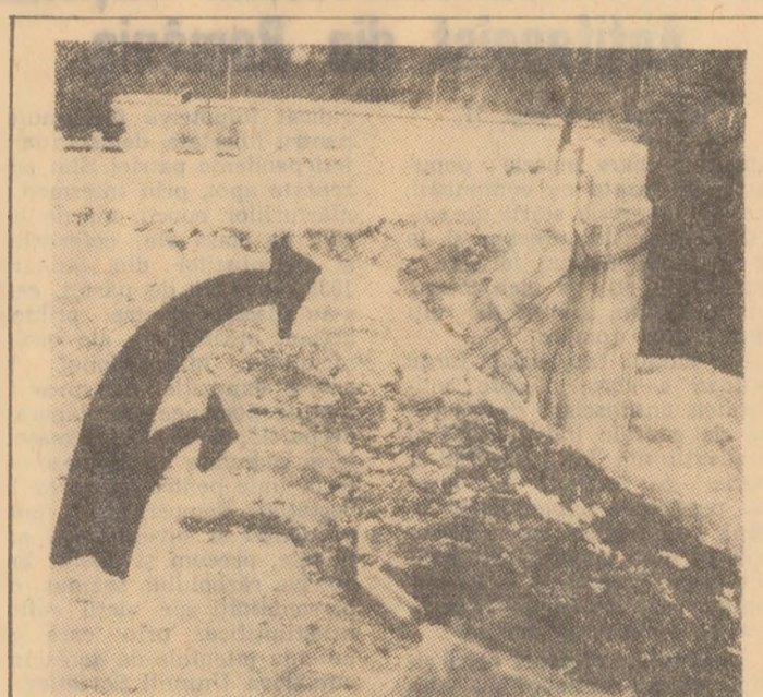
Ce se așteaptă pentru ca surprătura drumului să fie reparată? „Intrarea” unei mașini?

Dacă așa stau lucrurile în local, hotelul propriu-zis oferă alte modele de neglijență, de lipsă de grijă față de avutul obștesc, față de oamenii care vin să doarmă aici o noaptea sau mai mult. Subliniam „să doarmă” pentru că motelul este unora locuri de noapte, chefuri (în camere), a unor scandaluri care au lăsat urme chiar în unele camere. De la lipsa clăntelor la uși, la lenjeria nepălată sau spălată și necălcată, încă umedă, la prosoape de baie neșchimbate, la lipsa totală a luminii pe coridoarele hotelului, la pereții murdari, instalații sanitare neglijate ori la intreruptoare lipsă și capete de sîrmă scoase din lăcas, toate vorbesc de la sine despre modul cum este gospodărit hotelul. Exemplele (evidențiate pe camere n.n.) au fost scoase la iveală în cadrul unei „vizite” nocturne întreprinsă de redacția ziarului împreună cu organe de miliție ale