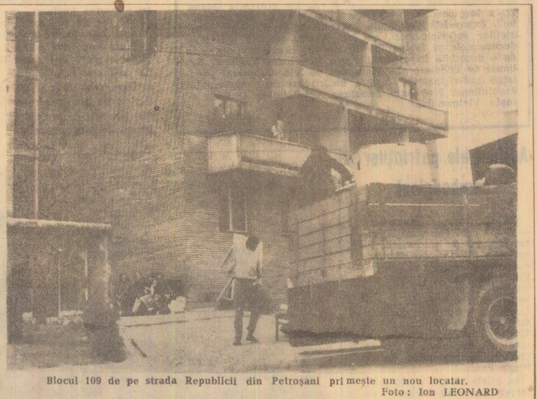
Blocul 109 de pe strada Republicii din Petroșani primește un nou locatar.