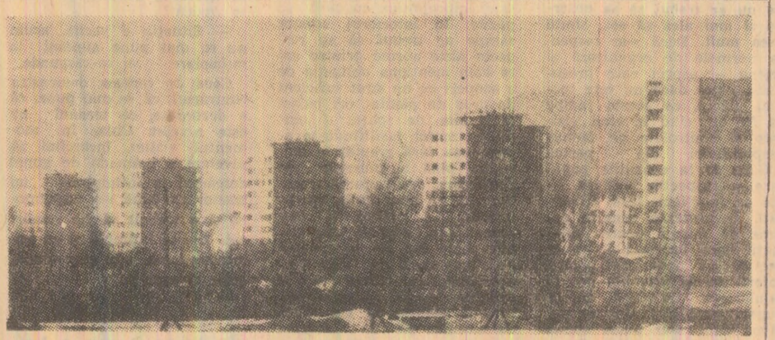
Almînerie în stil modern în vechiul oraș Petrița.