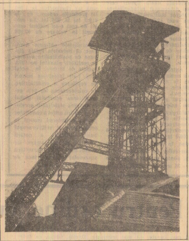
Doă imagini de la E.M. Vulcan — puțul de extracție existent la redeschiderea minei și cel de astăzi. Deosebirile dintre ele exprimă progresul tehnic și economic al Văii Jiului într-un sfert de veac.