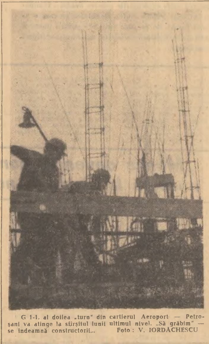
G 1-1. al doilea „turn” din cartierul Aeroport — Petrosani va atinge la sfârșitul lunii următor nivel. „Să grabim” — se îndeamnă constructorii...

An de an, cartierul Aeroport din Petrosani câștiga câteva zeci de metri teren, lărgindu-și granița către Livezeni, localitățile prelungindul pietrești blocuri de locuințe în folosul celor care muncesc în întreaga Vale. Citeva luni pînă cînd constructorii avansează îndepărtându-se „suntelul șantierului” să