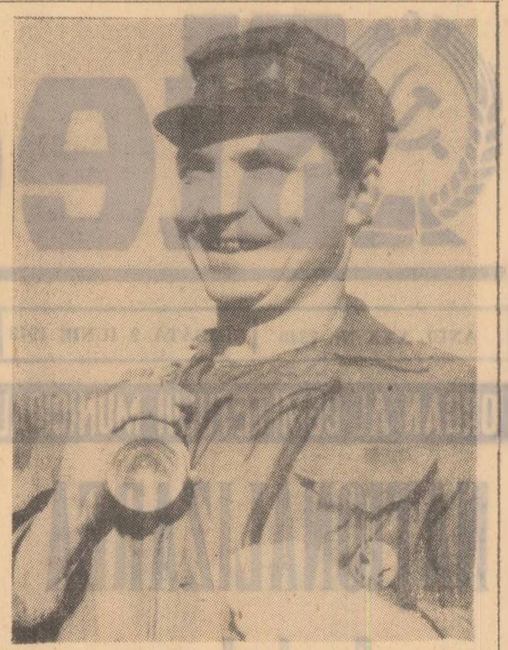
Anii construcției socialiste au un echivalent și în conștiința muncitorilor de astăzi, al cărui zîmbet, care luminează chipul înainte de a coborî în abataj, este generat de sentimentul de stăpîn și demnitatea de om.

Pentru a omagia izbînzile unui sfert de veac de cînd oamenii muncii au devenit proprietari și producători ai bunurilor societății, am ales o unitate minieră cu o bogată tradiție: MINA PETRILA. Ceea ce am constatat aici își păstrează valabilitatea pentru toate exploatarea noastră miniere. Comparațiile făcute între trecut și prezent sînt grăitoare pentru întreaga Vale a Jiului. Realitatea pe care o avem cu toții în față, astăzi, este grăitoare față de clișeele din trecut, de pe care am șters pentru moment colbul timpului, pentru a ilustra drumul parcurs în anii industrializării socialiste de către municipiul nostru, realizările datorate actului istoric al naționalizării.