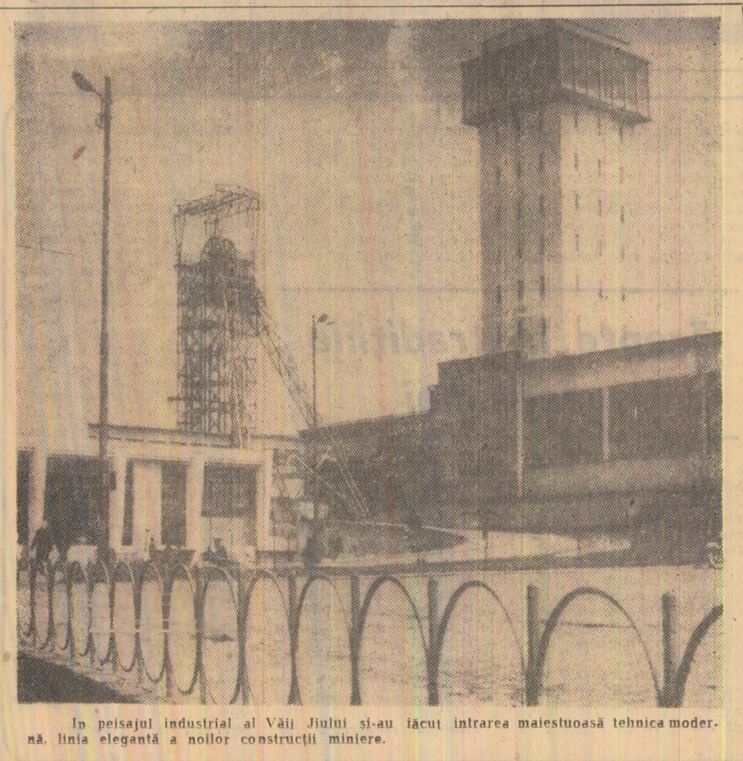
În peisajul industrial al Văii Jiului și-au făcut intrarea maiestuoasă tehnica modernă, linia elegantă a noilor construcții miniere.

Situația e veche, acum nu se mai pune gunoii la întimplare — ni se răspunde. Ceea ce vedem demonstra contrariul, că se mai pune, că e dezordonat, că terenul nu este nivelat. Chiar în momentul vizitei, încercînd să niveleze o grămadă de gunoi descărcat la întimplare, un tractor cu lamă s-a împotmolit și a trebuit să fie remorcat. Așa se întîmplă și cu autotracioanele, așa este stranzul transportul.