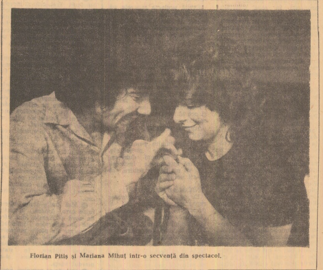
Florian Pitish și Mariana Mihut într-o scenă din spectacol.