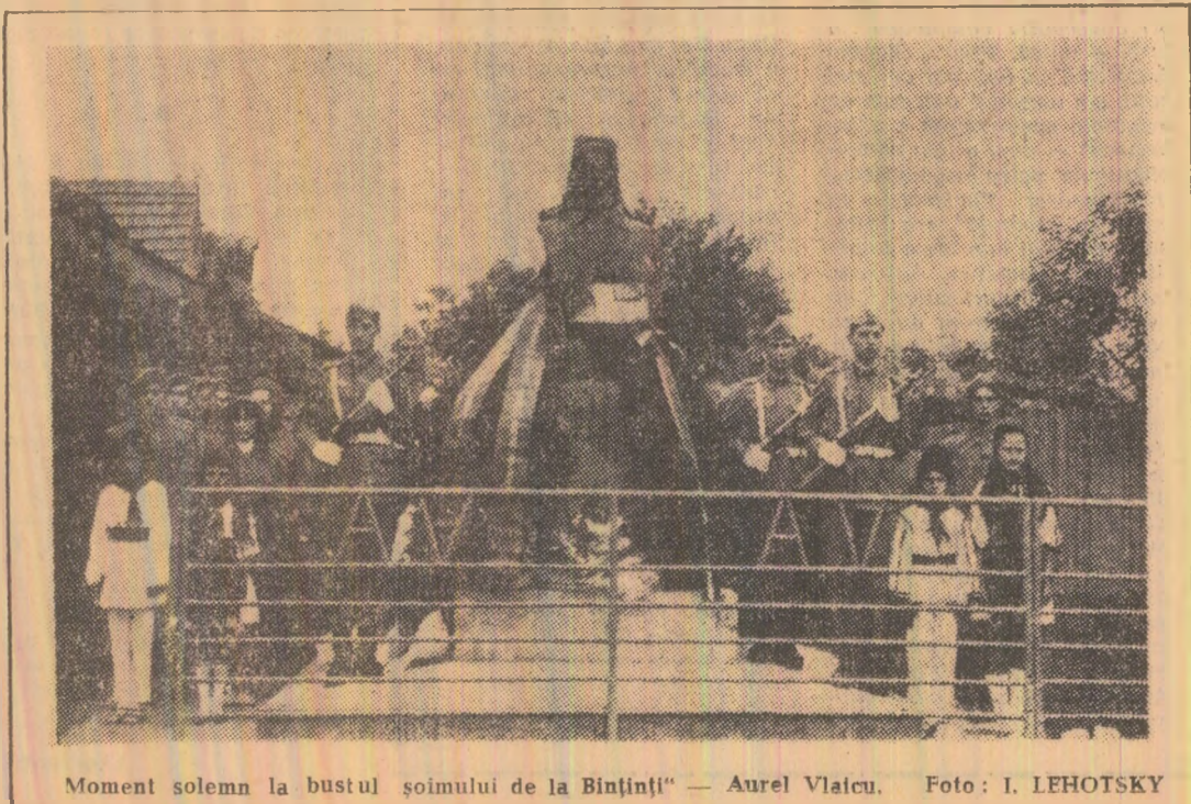
Moment solemn la bustul șoimului de la Bințișni — Aurel Vlaicu.