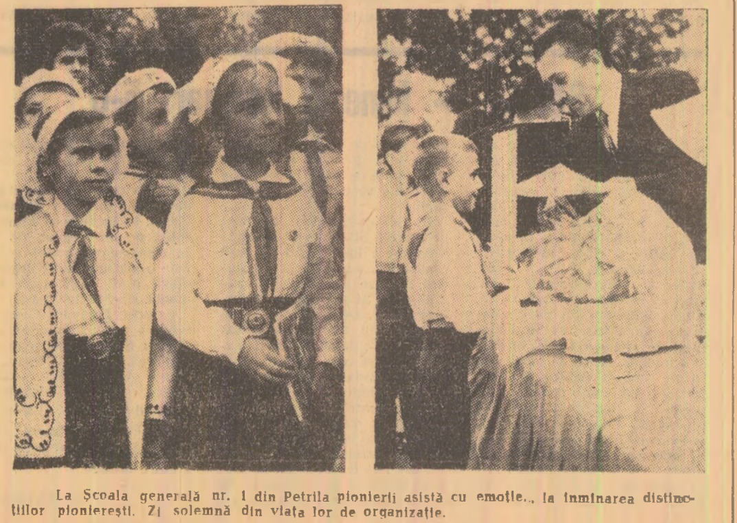
La Școala generală nr. 1 din Petrolia pionierii asistă cu emole. la înmînarea distincțiilor pionieresti. Zi solemnă din viața lor de organizație.

Festivitățile au luat sfîrșit cu un frumos program artistic dat de formațiile artistice ale celor două școli.