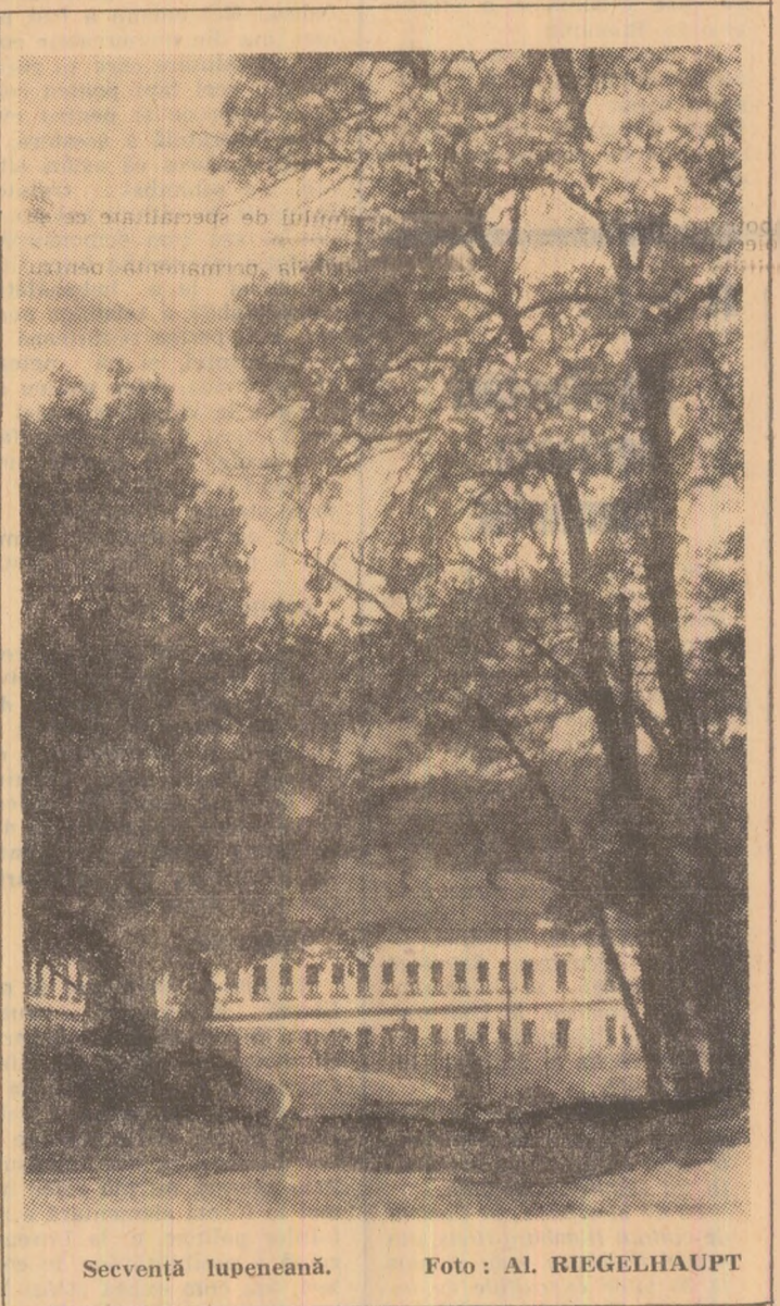
Secvență lupeneană.