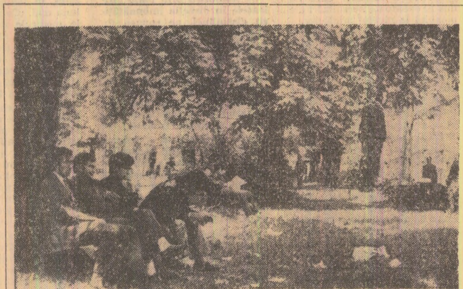
„Pensionarii” parcului privesc blazati la ora 11,30 promenada străzii. Și ce dacă distrug iarba?!