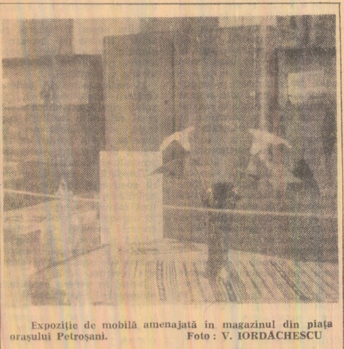
Expoziție de mobilă amenajată în magazinul din piața orașului Petrosani.

locul afecțiunii se realizează o încălzire omogenă și de profunzime. Durata maximă de funcționare a aparatului este de circa 30 minute. „Diatermus M 5302”, intrat în producția fabricii de aparate electronice de măsură și industriale - București, a dat rezultate excelente în combaterea unor afecțiuni ca: spondiloză, lombosciatică, tracțiuni musculare, tulburări circulatorii, afecțiuni endocrine sau tulburări ale stării generale (astemii, insomii, nevroze). La rîndul lor, specialiștii Clinicii balneologice - Cluj, acționînd în direcția combaterii afecțiunilor reumatismale, au stabilit, recent, o metodă cu ultrasunete - ultrasonoterapia. Iradierea cu ultrasunete are fost aplicată pe parcursul a 10-12 sedințe unul număr de 36 de bolnavi cu afecțiuni reumatismale ale coloanei vertebrale. Prin utilizarea dozelor mici de ultrasunete - sub un watt pe centimetru pătrat - s-au obținut rezultate profilactice surprinzătoare. (Agerpres)