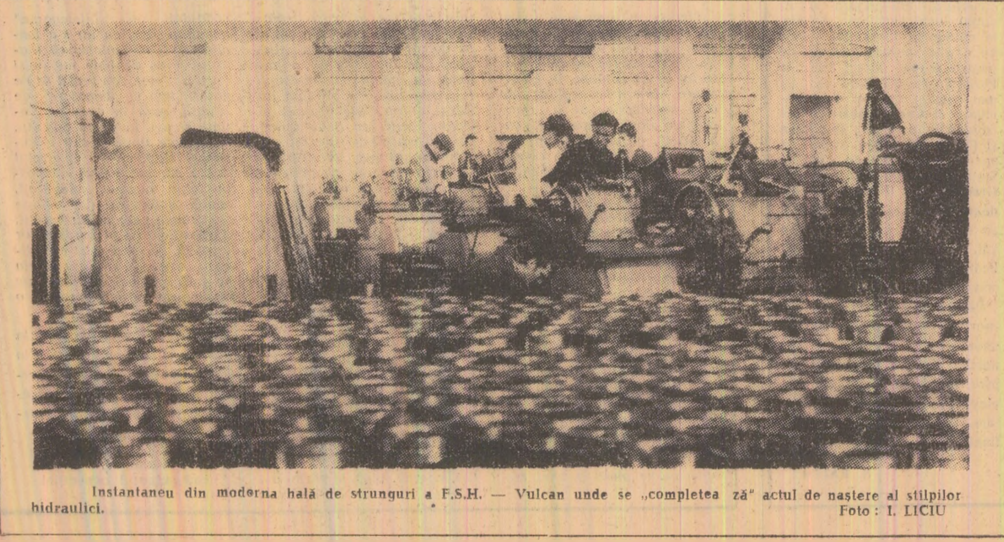
Instantaneu din modernă hală de strunguri a F.S.H. — Vulcan unde se „completează” actul de naștere al stîlpilor hidraulici.