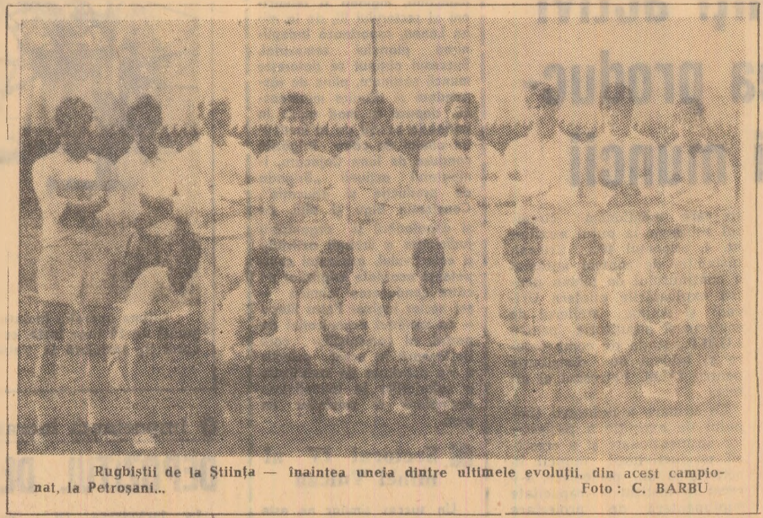
Rugbiștii de la Știința — înaintea uneia dintre ultimele evoluții, din acest campionat. La Petroșani...