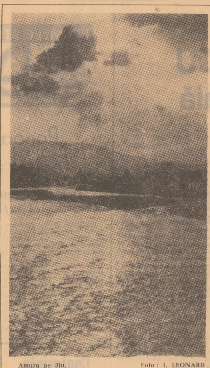
Amurg pe Jiul.