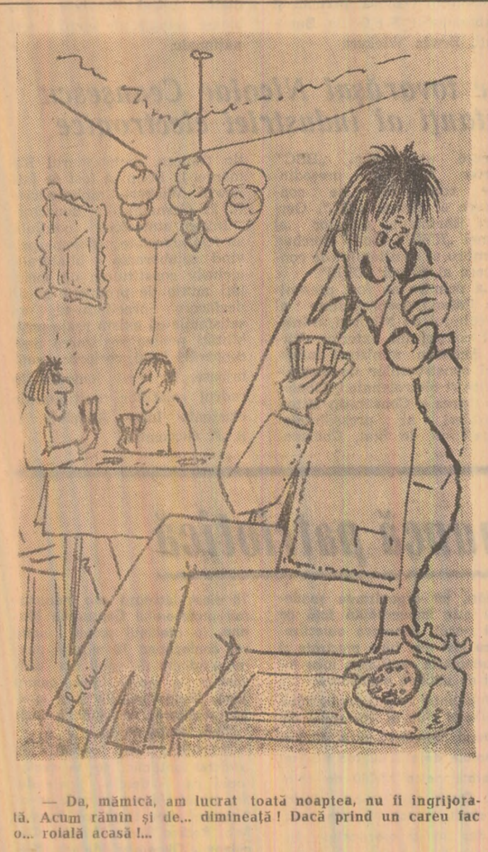
— Da, mămică, am lucrat toată noaptea, nu fi îngrijorată. Acum rămîn și de... dimineață! Dacă prind un caru fac o... roială acasă!