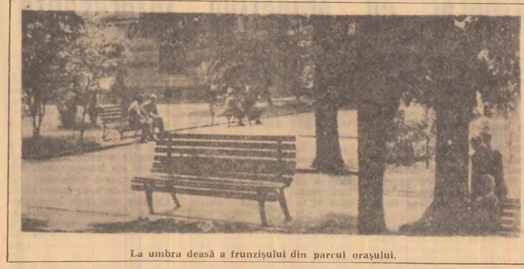
La umbra deasă a frunzișului din parcul orașului.