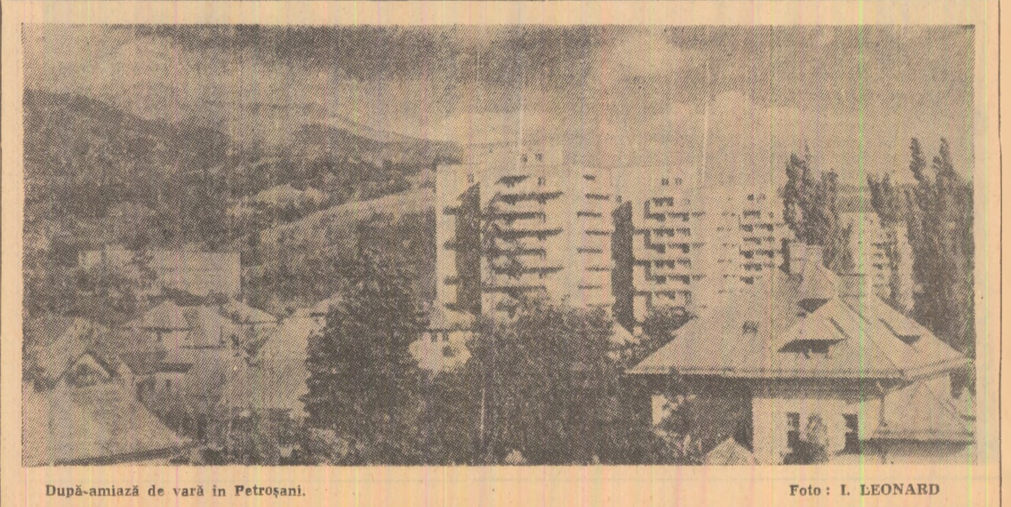
După-amiază de vară în Petroșani.