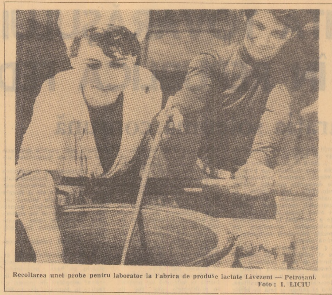
Recoltarea unei probe pentru laborator la Fabrica de produse lactate Livezeni — Petroșani.

Pe gestionarul unității nr. 23 din Uricani, Nicolae Protesașu,