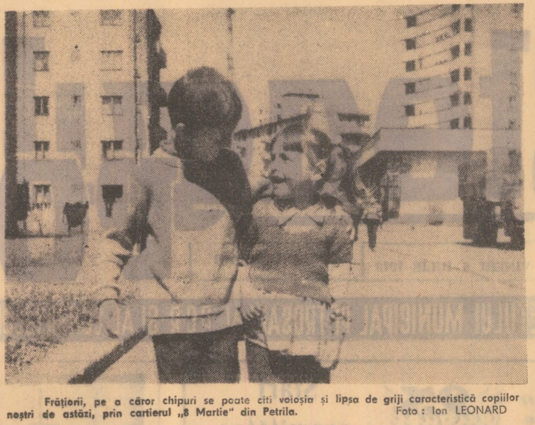
Frățiori, pe a căror chipuri se poate citi voioșia și lipsa de grijă caracteristică copiilor neștri de estăzi, prin cartierul „8 Martie” din Petrolia.

Pînă la elaborarea acestei legi, art. 180 al. 2 din codul penal prevedea că lovirea sau actele de violență care au pricinuit unei persoane o vătăm-