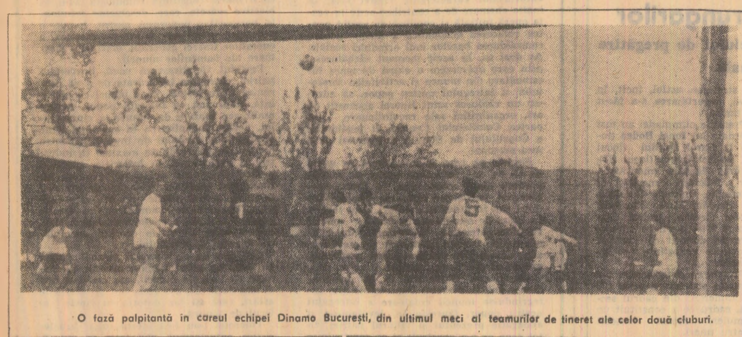
O fază palpitantă în careul echipei Dinamo București, din ultimul meci al tinerilor ale celor două cluburi.