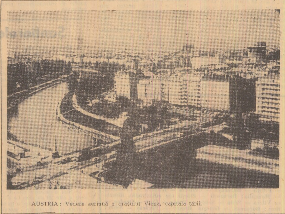
AUSTRIA: Vedere aeriană a orașului Viena, capitala țării.

Valorile temperaturii înregistrate în cursul zilei de ieri: Maximele: Petroșani 25 grade; Pating 17 grade. Minimele: Petroșani 15 grade; Pating 11 grade. PENTRU URMĂTOARELE 24 DE ORE: Vreme frumoasă mai ales în cursul dimineții. După-amiază cerul se va înnoira și ca urmare se vor produce averse locale de ploaie însoțite de descărcări electrice. Vîntul va sufla slab pînă la potrivit din sectorul estic.