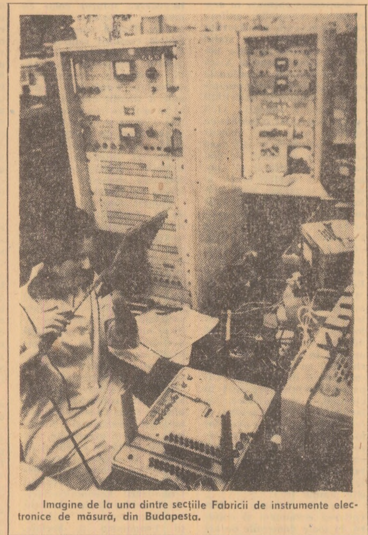
Imagine de la una dintre secțiile Fabricii de instrumente electronice de măsură, din Budapesta.

Cursul dolarului american a continuat miercuri să scadă pe piețele occidentale fără vreun motiv special, aparent, după cum relevă agenția United Press International. Singura explicație este lipsa de încredere în moneda americană — declara experții, care adaugă că ceva trebuie să se întâmple în curând pentru a se opri acest declin continuu.