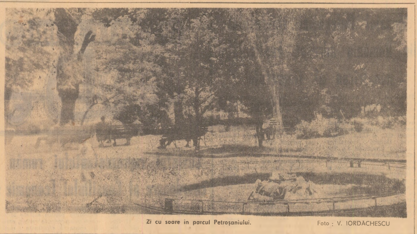
Zi cu soare în parcul Petroșaniului.

Marcind încheierea unui an de la Conferința Națională a partidului, în aceste zile — premergătoare celei de a 29-a aniversări a eliberării patriei — ziua insurecției naționale antifasciste armate, comunistii, oamenii muncii din Valea Jiului, asemeni întregului popor, sînt mai înălțării ca orînd să-și consacre întreaga capacitate și energie creatoare pentru a transpune în viață sarcinile trasate de Conferința Națională, de plenele Comitetului Central al partidului în vederea accelerării dezvoltării economico-sociale a patriei, realizării înainte de termen a planului cincinal, creșterii mai rapide a bunăstării maselor, ridicării patriei pe treptele superioare ale civilizației moderne.