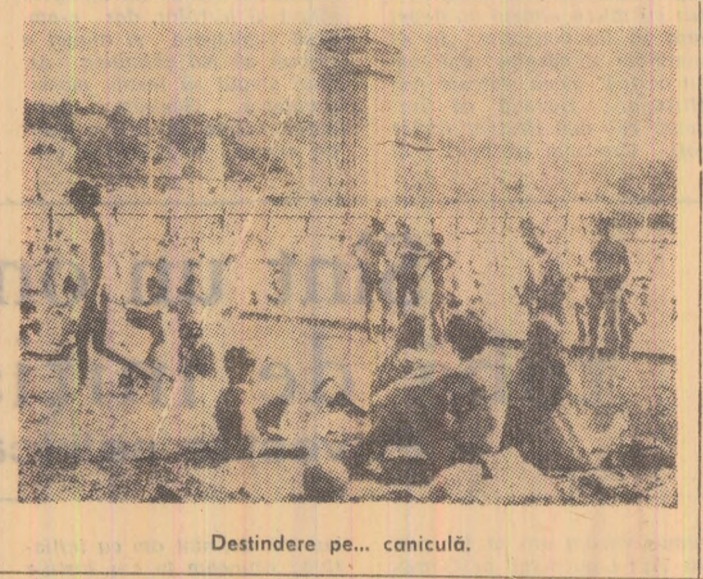
Destindere pe... caniculară.