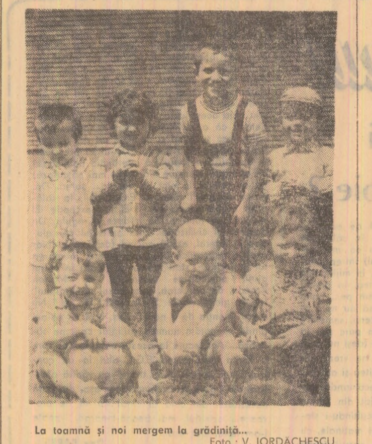
La toamnă și noi mergem la grădiniță...

...s-a dat în folosință un nou sat de vacanță. Situat la trei km de renumita stațiune Călimănești, noua amenajare turistică de la Seaca dispune de 120 de locuri în casute, un mic restaurant cu o bucătărie haiducească, o terasă și un loc de parcare auto. Se află în curs de amenajare o plajă și unstrand. O veste similară și de la Oțele Mari, stațiune care datorită existenței unui lac cu apă iodată atrage în fiecare vară un mare număr de vizitatori. Aici a fost amenajat de asemenea un sat de vacanță cu 100 de locuri.