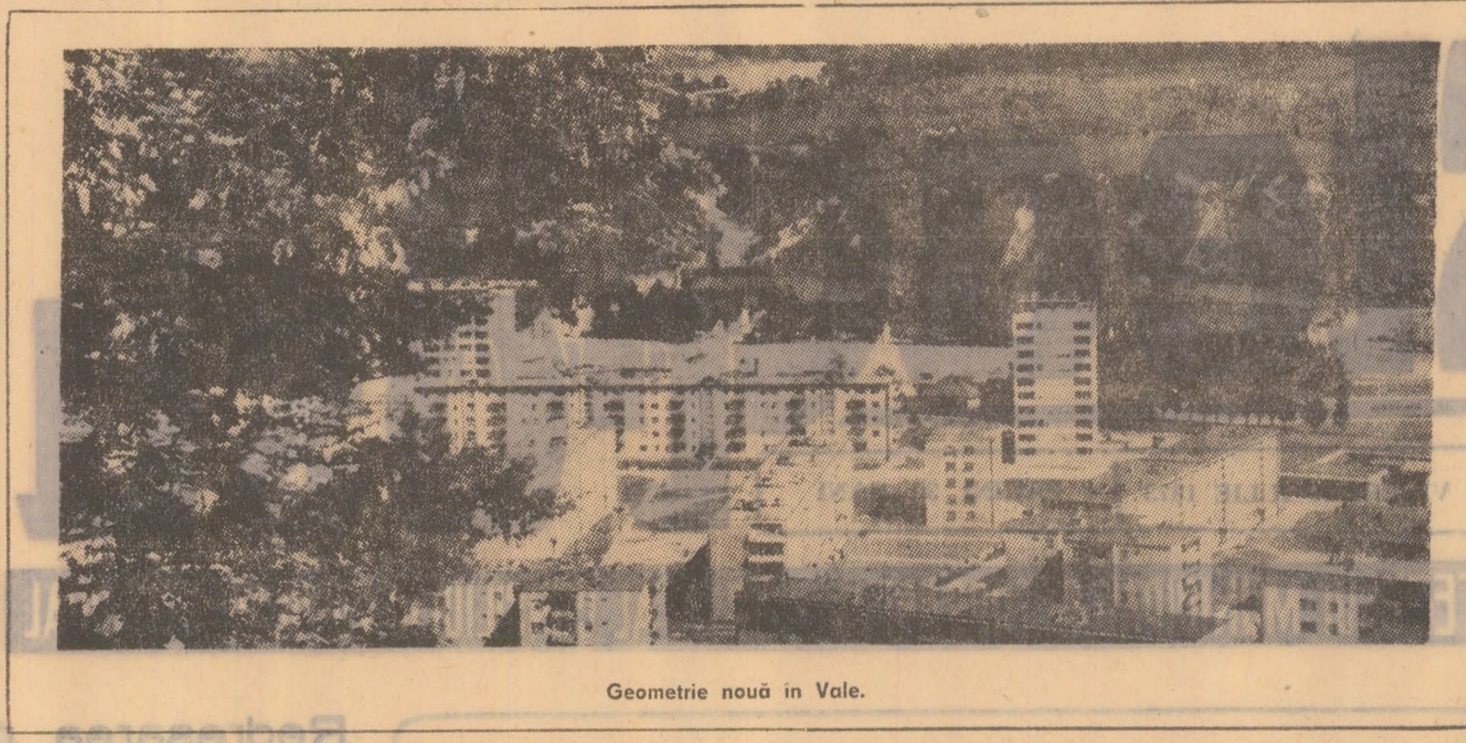
Geometrie nouă în Vale.