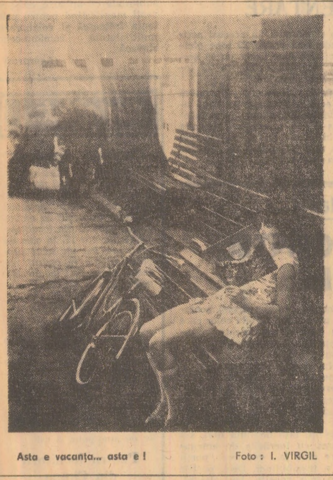
Asta e vacanța... asta e!