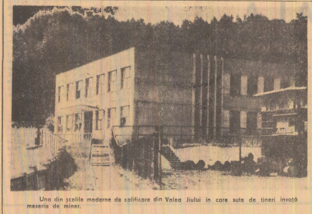
Una din școlile moderne de colificare din Valea Jiului în care sînt de tineri învățați meseria de miner.