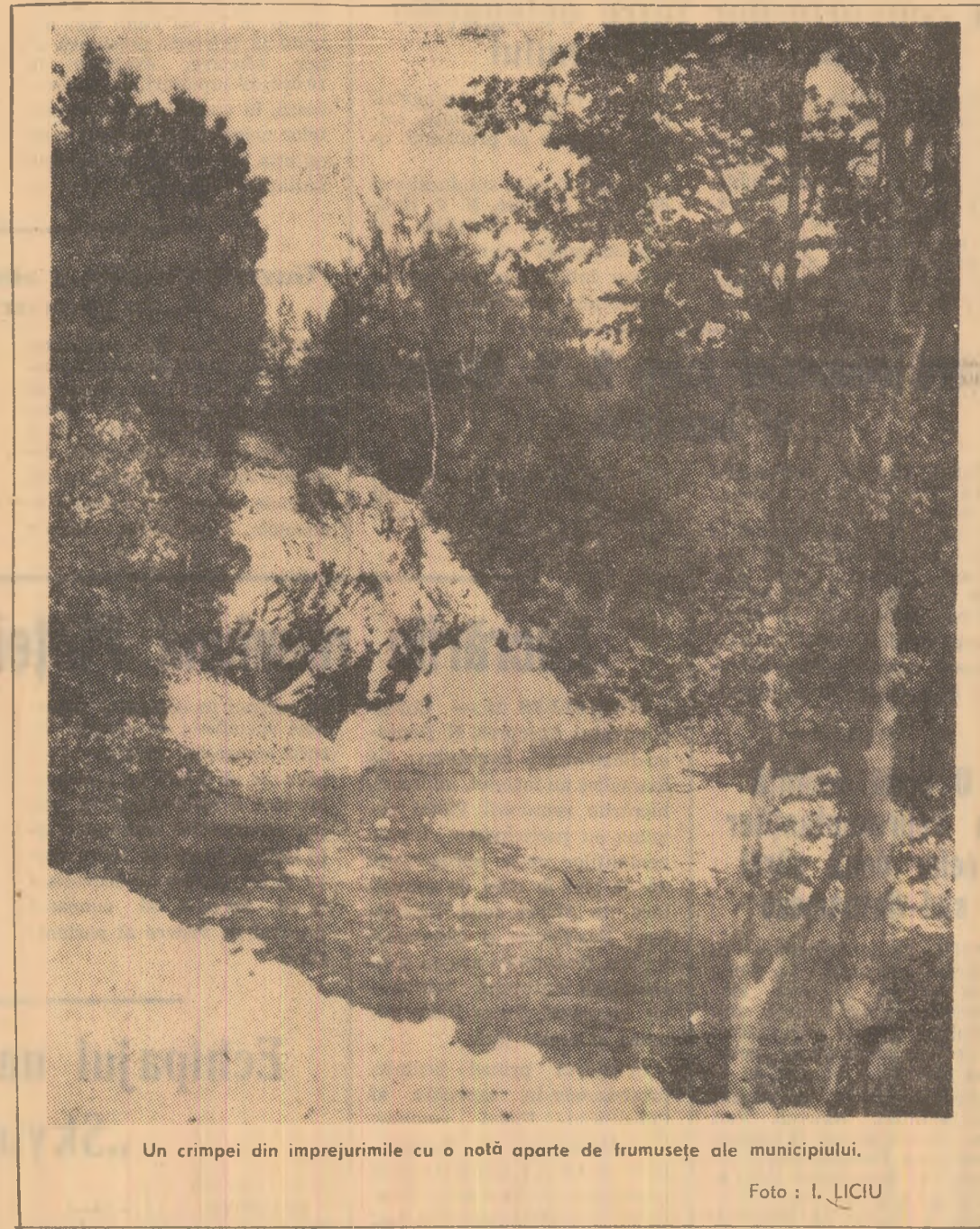
Un crîmpei din împrejurimile cu o notă aparte de frumusețe ale municipiului.

în funcțiune, la apartamentele unde s-au spart pereții în urma reparațiilor făcute la instalațiile sanitare au fost astupate spărturile. De asemenea subsolul tehnic a fost curățat și dezinfecțat. S-a atras apoi atenția conducerii sectorului fond locativ Vulcan, respectiv tovarășului Aurel Moraru, ca pe viitor să întreprindă măsuri mai operative față de reclamațiile locatarilor”.