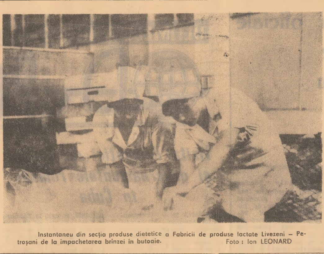
Instantaneu din secția produse dietetice a Fabricii de produse lactate Livezeni — Petroșani de la împachetarea brinzii în butoaie.