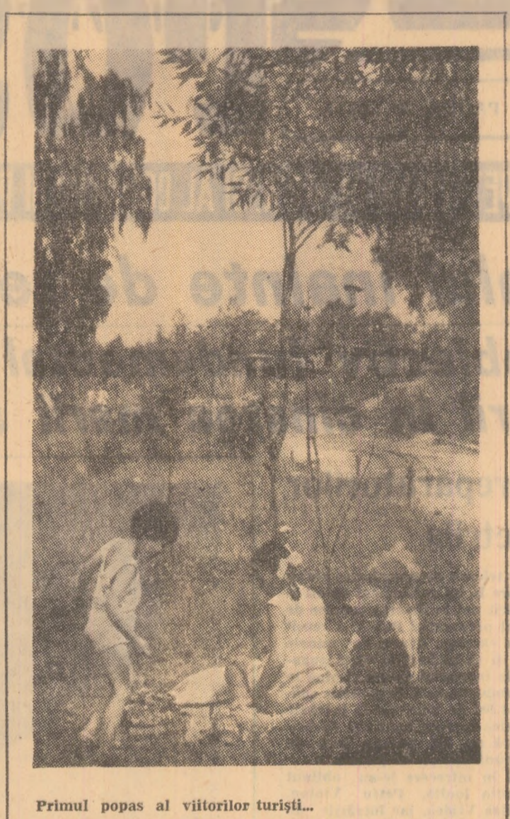
Primul popas al viitorilor turiști...

Orice concurs e o provocare și o tentație. Inventivitatea organizatorilor se confundă cu pregătirea și șansa participanților... „Recunoașteți interpretul?” e un concurs (cu premii importante) organizat de A.T.M. în colaborare cu revista „Ateneu”, care se vrea, prin însăși condiția și modalitățile sale, un act de cultură. El propune o temă de indiscutabilă atracție și popularitate, invitând la cunoașterea intimă a dramaturgiei românești, clasice și contemporane, a interpretelor săi din marjoritatea teatrelor țării... Buletinele de concurs s-au pus în vînzare la toate chioscurile de difuzare a presei din întreaga Vale a Jiului.