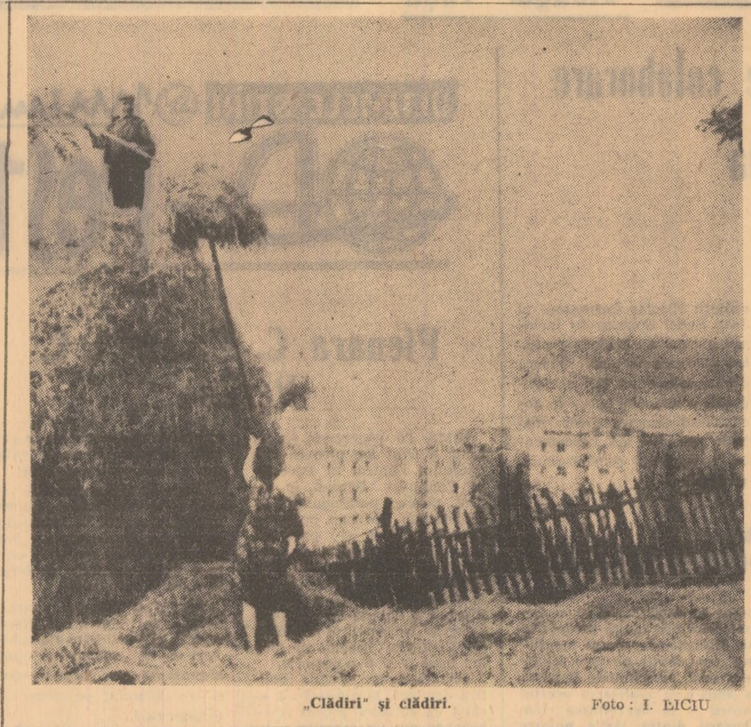
„Clădiri” și clădiri.