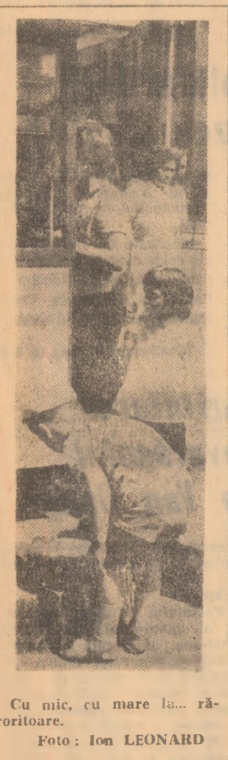
Cu nic, cu mare la... răcoritoare.

În 1924, marele creator epic Liviu Rebreanu și-a expus concepția sa în privința structurii beletristice. Răspunzînd unei anchete a revistei „Ideea europeană”, el scria: „Nu frumosul, o născocire omească, interesează în artă, ci pulsația vieții. Cînd al reușit să închiid în cuvinte clipe de viață adevărată, ai realizat o operă mai prețioasă decît toate frazele din lume. Durabilitatea literaturii atîmă numai de viața veritabilă ce o cuprinde”, în mapele de autograf ale scriitorului, cercetate de specialiștii Bibliotecii academiei, au fost descoperite și alte asemenea prețioase măturisiri. Autorul lui „Ion” scria, de pildă: „De dragul unei fraze strălucite sau a unei noi perecheri de cuvinte, nu aș sacrifica niciodată o intenție. Prefer să fie expresia bolovănoasă și să spun într-adevăr ce vreau, decît să fiu șlefuit și neprecis. Strălucirile stilistice, cel puțin în opere de creație, se fac mai totdeauna în detrimentul preciziei și al mișcării de viață. De altfel, cred că e mai ușor a scrie frumos” decît a exprima exact”. Credincios acestui crez, scriitorul își îmbunătățea limba redacției, condus de o neobișnuită perseverență și spirit autocritic. Zeci de manuscrise, șpalțuri de tipografie, texte de conferințe, dactilografiate cercetate în ultimul timp, scot cu pregnanță în evidență procedeele artistice ale romancierului, lipsite de artificialitate, bazate pe o continuă selectare, mereu mai aproape de puterea exactității.