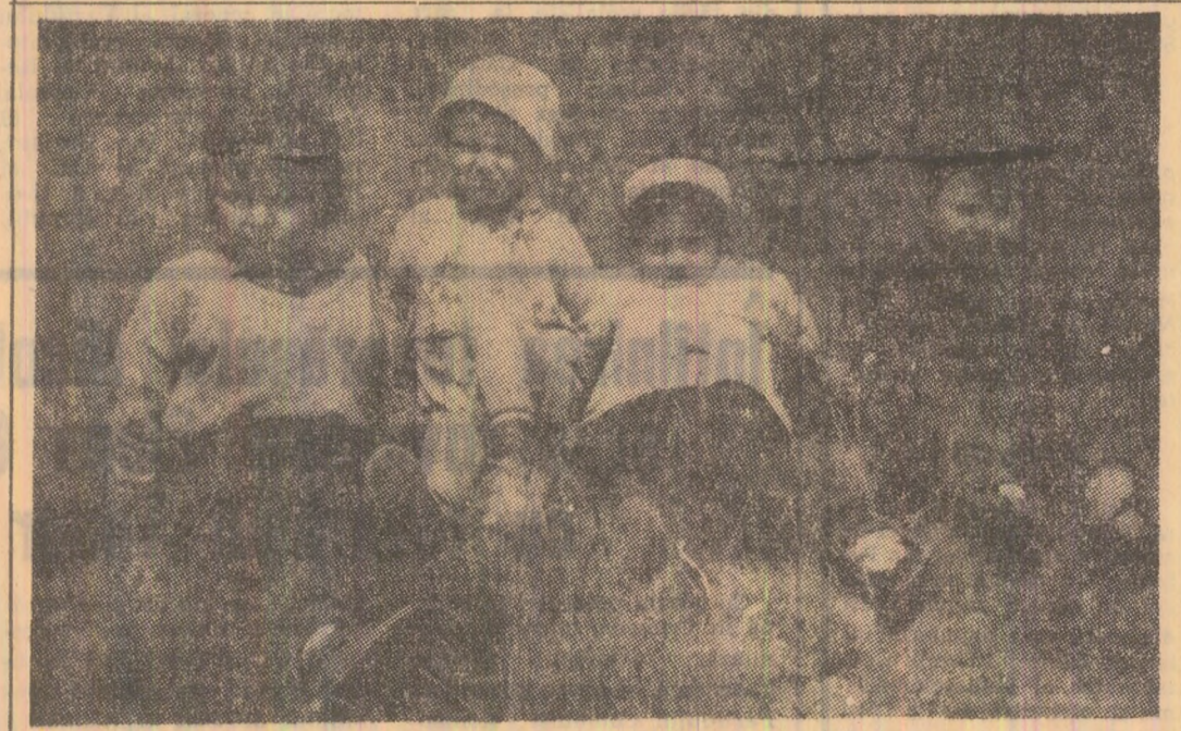
Un moment de răgaz pentru o fotografie, apoi din nou la joacă...

În vederea eliminării importului unor utilități costisitoare, în cadrul întreprinderii „Metalul Roșu” din Cluj au fost asimitate, în fabricație de serie, instalațiile „Fulard” pentru apreat, spălat și impregnat țesături. Primul lot va fi montat în diferite țesătorii din țară încă în cursul acestui an. Tot aici, a fost lansată în fabricație o instalație complexă de vopsit, spălat și albit fire în sculuri. Instalația este de fapt o întreagă linie tehnologică alcătuită din mai multe autoclave, stație de ventilație, centrală de termoreglare, sistem de vacuumare și alte subsansamble.