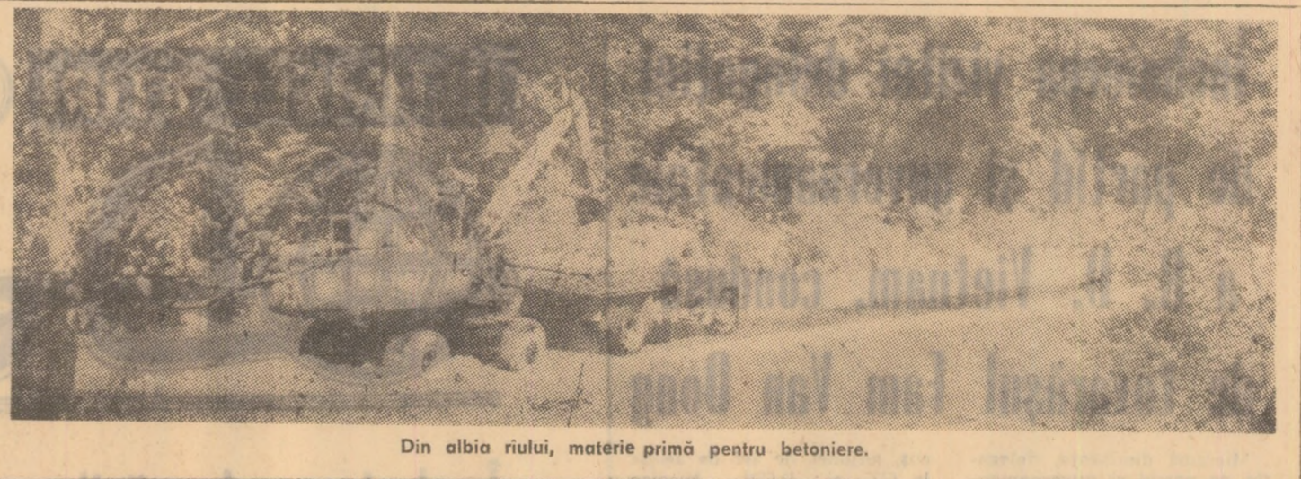
Din albia riului, materie primă pentru betoniere.

ganizația de bază din sectorul III. Primul care s-a angajat să participe activ la traducerea ei în viață a fost comunistul Dumitru Trăivan, maestru minei. El a asigurat adunarea generală că