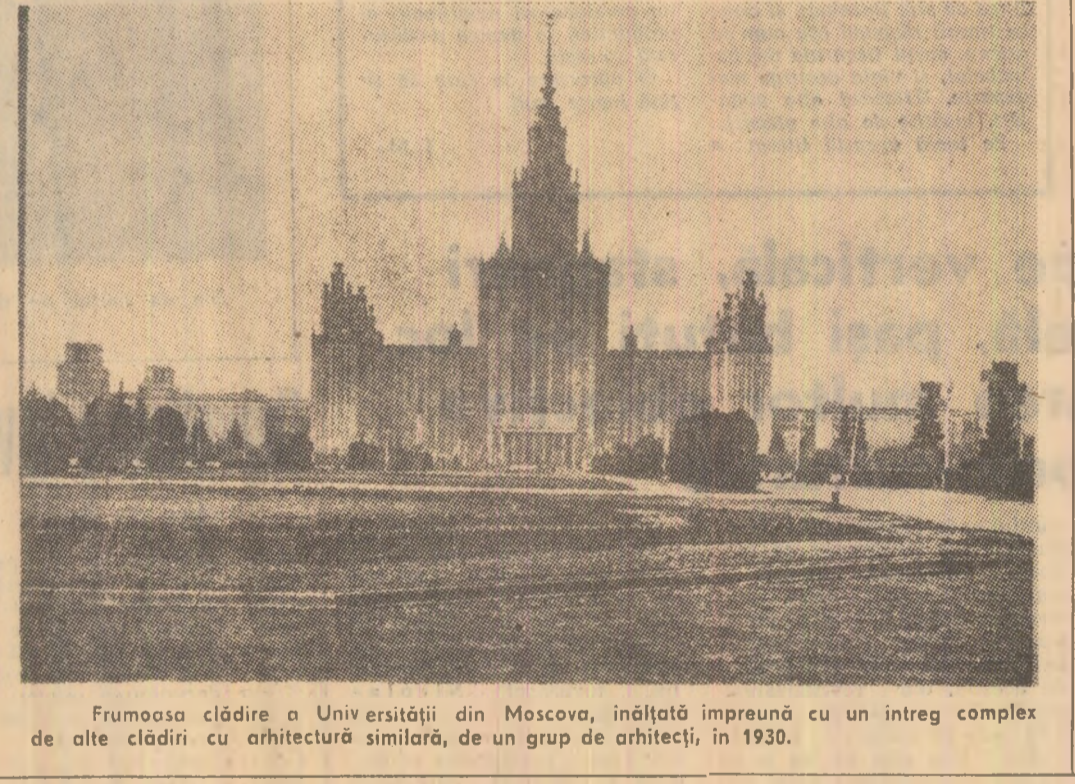
Frumoasa clădire a Universității din Moscova, înălțată împreună cu un întreg complex de alte clădiri cu arhitectură similară, de un grup de arhitecți, în 1930.