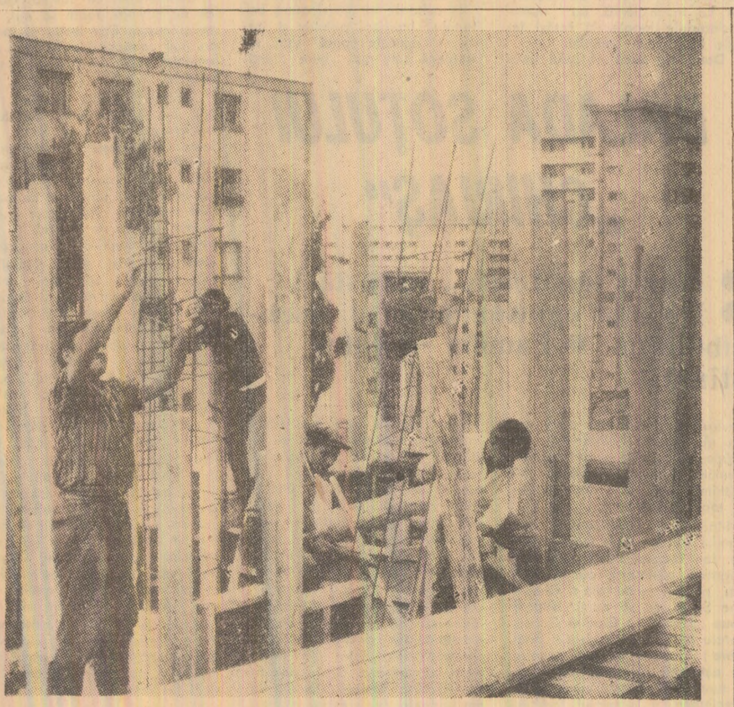
Pe șantierul din Petrița fierar-betonistii realizează nervura metalică a unui nou bloc. Alături de ei și dulgherii mențin un ritm alert de lucru, pentru a asigura predarea în termen a unui nou bloc pentru mineri.

de comitetul oamenilor muncii, adunării reprezentanților salariaților. Acesta, însă, departe de a fi rezultatul unor străduințe și frământări care să aducă în fața salariaților cele mai ardeante probleme, și cele mai potrivite soluții pentru recuperarea restanțelor, realizarea exemplară a planului pe semestrul II și pregătirea activității pe anul următor, s-a rezumat la măsuri generale, fără un conținut concret, fără orizont. Unele din aceste măsuri sînt: de-a dreptul de competență (dacă putem folosi expresia) echipelor. „Transportul cu roaba se va face pe dulapi metalici care se vor da în inventarul șefului de lot” — sună una din aceste măsuri pe care am reținut-o, drept exemplu, pentru a ilustra „nivelul” planului de măsuri. Înșasi numărul acestora (al măsurilor) este grăitor. Prin ele, nici mai mult, nici mai puțin de 37 măsuri propuse, s-a încercat, pe de o parte, acoperirea tuturor problemelor ce stau în fața șantierelor, sau echipelor, iar pe de altă parte, mobilizarea cel mai multor compartimente într-o muncă de amploare, aducînd soluționări pentru unele neajunsuri. Dar la nivelul șantierelor sau al formațiilor de lucru, și nu la nivelul de preocupări și competențe al grupului de șantier. Așa se explică neabundarea soluționării unor probleme și nu a constituit momentul care să marcheze o