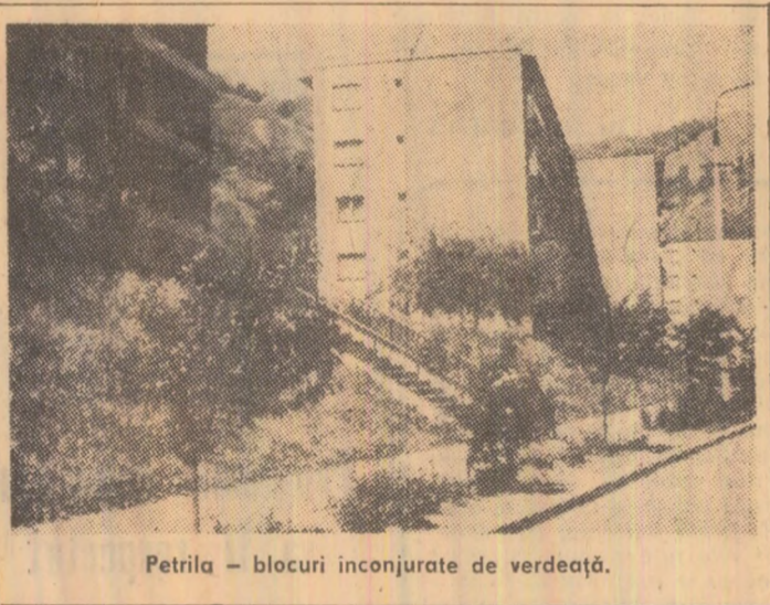
Petritu - blocuri inconjurate de verdeata.