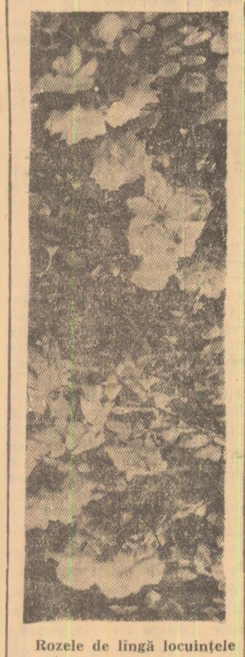
Rozele de lingă locuințele noastre.