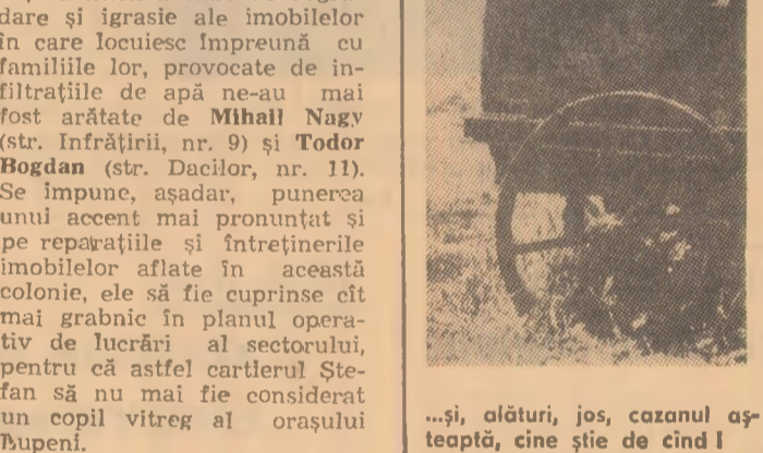
...și, alături, jos, cazanul așteptă, cine știe de cînd!