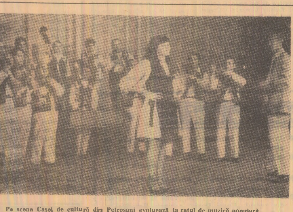
Pe scena Casei de cultură din Petroșani evoluează ta raful de muzică populară.