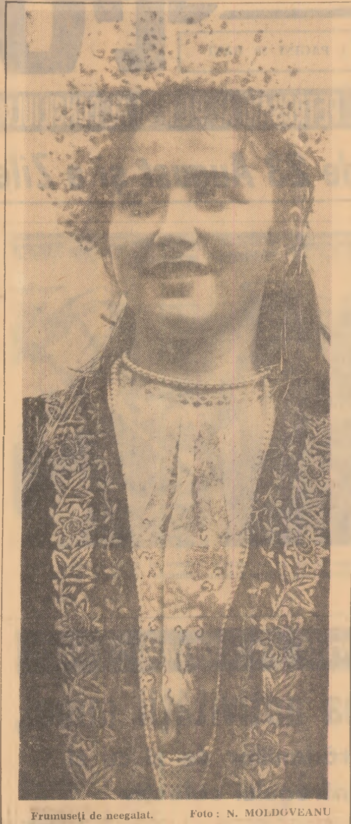
Frumuseți de neegalat.

— Este vorba, așadar, de un calendar bogat de manifestări cultural-artistice. Reușita lor va depinde, în mod hotărâtor, de atenția și responsabilitatea cu care se desfășoară pregătirile. V-am ruga, deci, tovarășe Chirculescu, să accentuați în câteva cuvinte sarcinile factorilor de răspundere în pregătirea manifestărilor dedicate Zilei minerului.