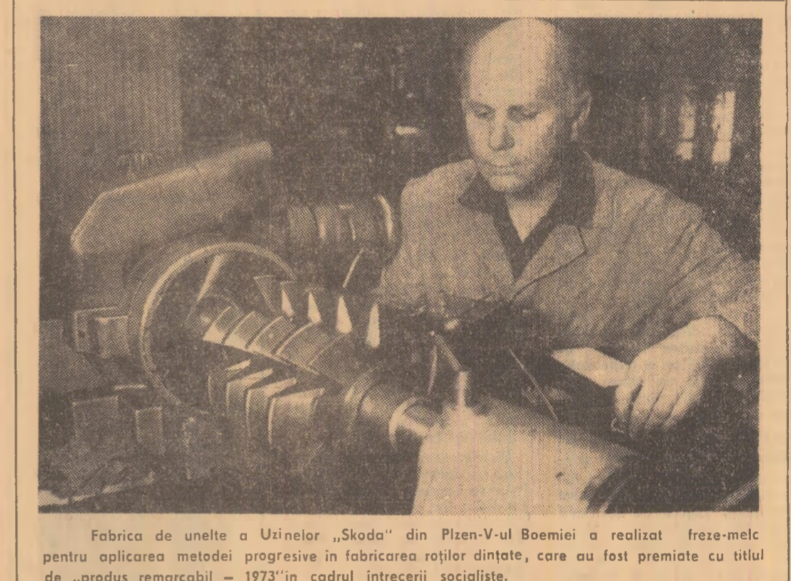
Fabrica de unelte a Uzinelor „Skoda” din Pízen-Vul Boemiei a realizat freze-melc pentru aplicarea metodei progresive în fabricarea roților dinate, care au fost premiate cu titlul de „produs remarcabil - 1973” în cadrul întrecerii socialiste.

De asemenea, reprezentanții noștri au participat la mișcările de solidaritate cu lupta popoarelor și tineretului din Angola, Mozambic, Guineea-Bissau și Insulele Capului Verde împotriva coloniștilor portughezi, pentru independența națională, precum și la manifestarea legată de împlinirea a 28 de ani de la lansarea bombei atomice asupra Hiroșimei.