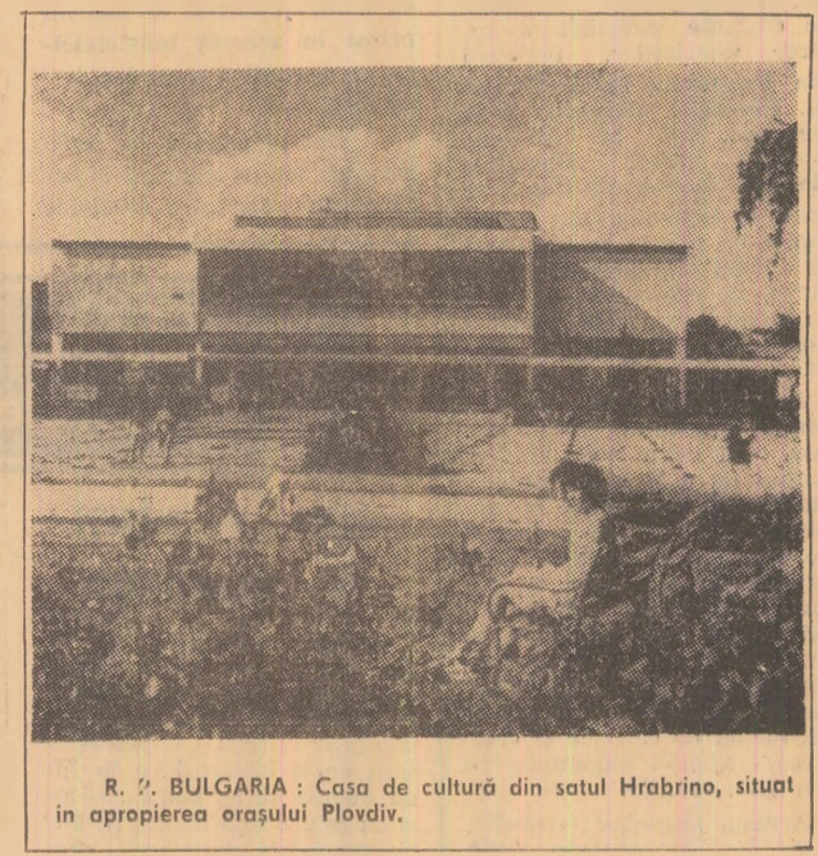
R. P. BULGARIA: Casa de cultură din satul Hrabrino, situat în apropierea orașului Plovdiv.