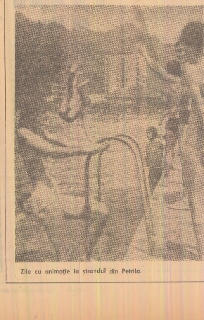
Zile cu animație la ștrandul din Petrița.