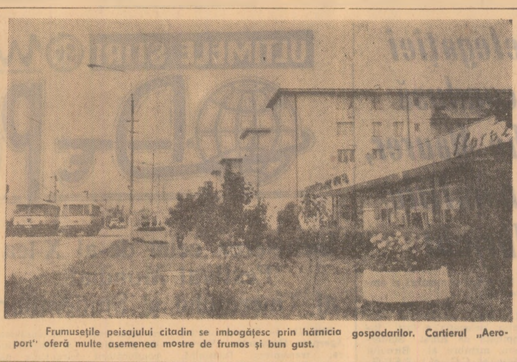
Frumusețile peisajului citadin se îmbogățesc prin hămicia gospodărilor. Cartierul „Aeropot” oferă multe asemenea mostre de frumos și bun gust.