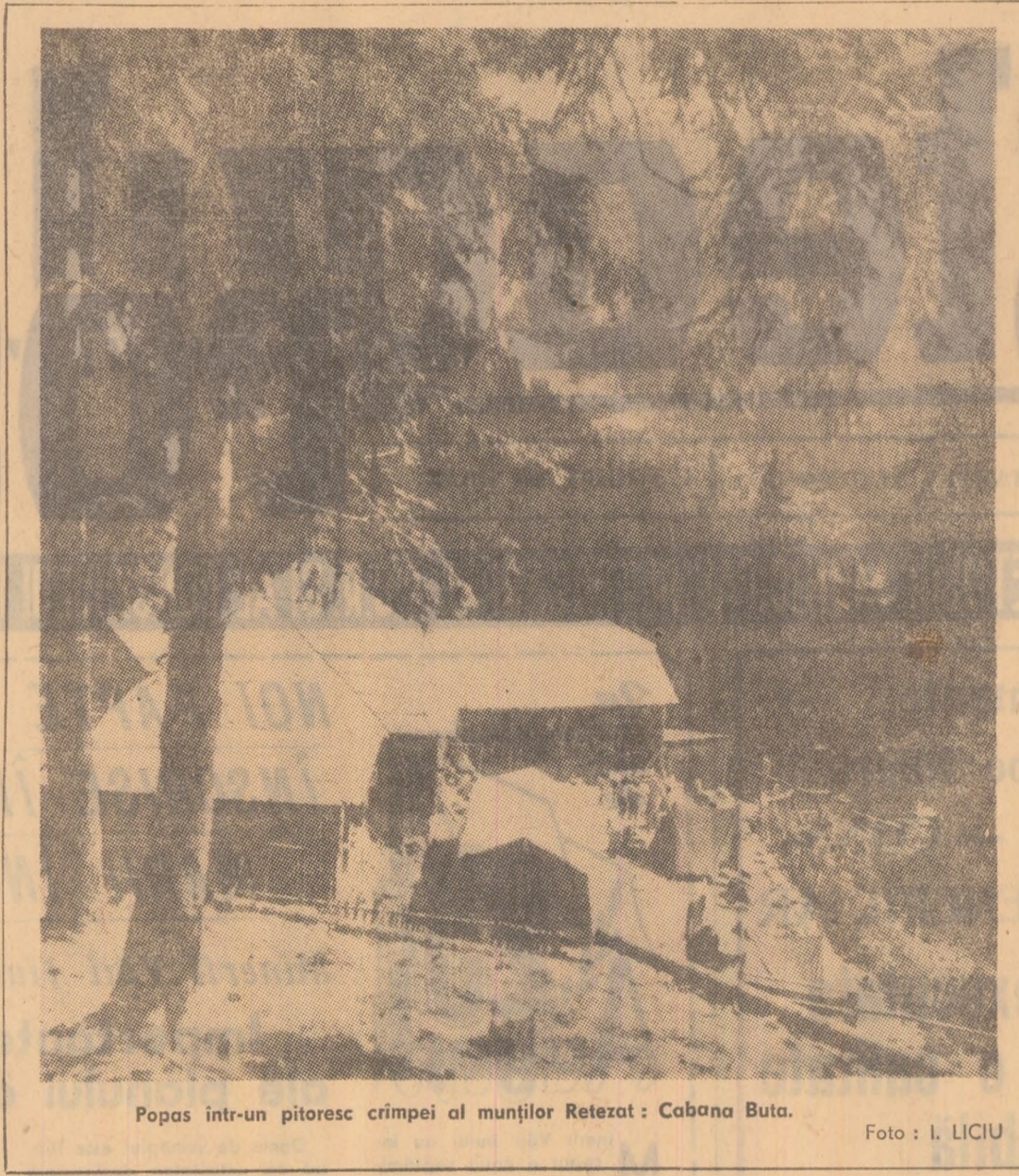
Popas într-un pitoresc crîmpie al munților Retezat: Cabana Buda.