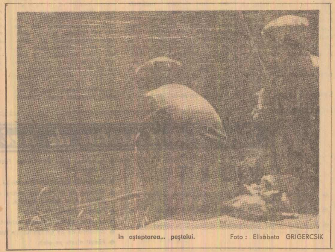
În așteptarea... peștelui.