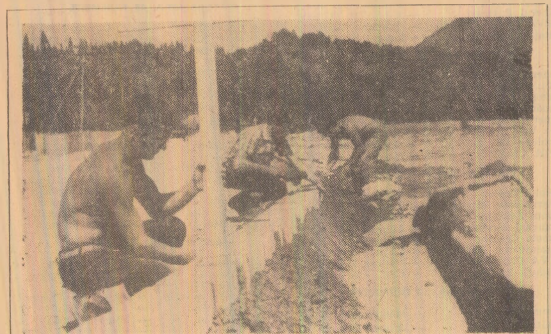
Metru cu metru, bordura șoselei cîștigă tot mai mult teren.