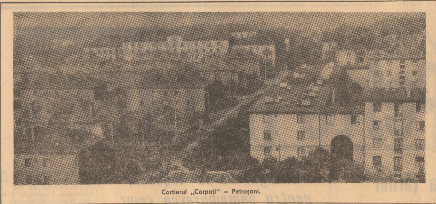
Cartierul „Carpați” — Petroșani.