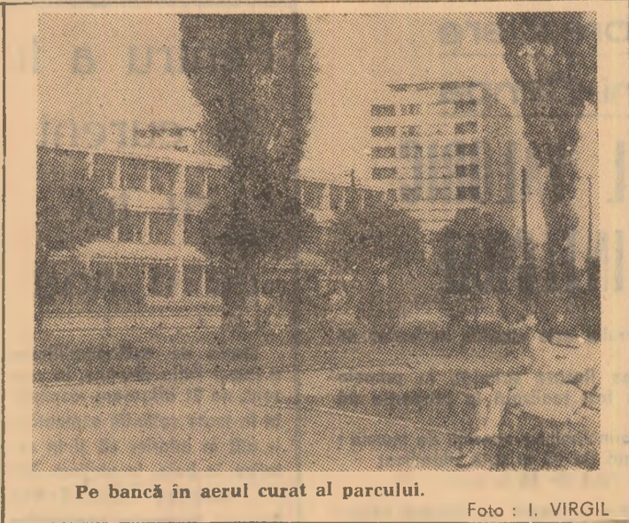
Pe bancă în aerul curat al parcului.