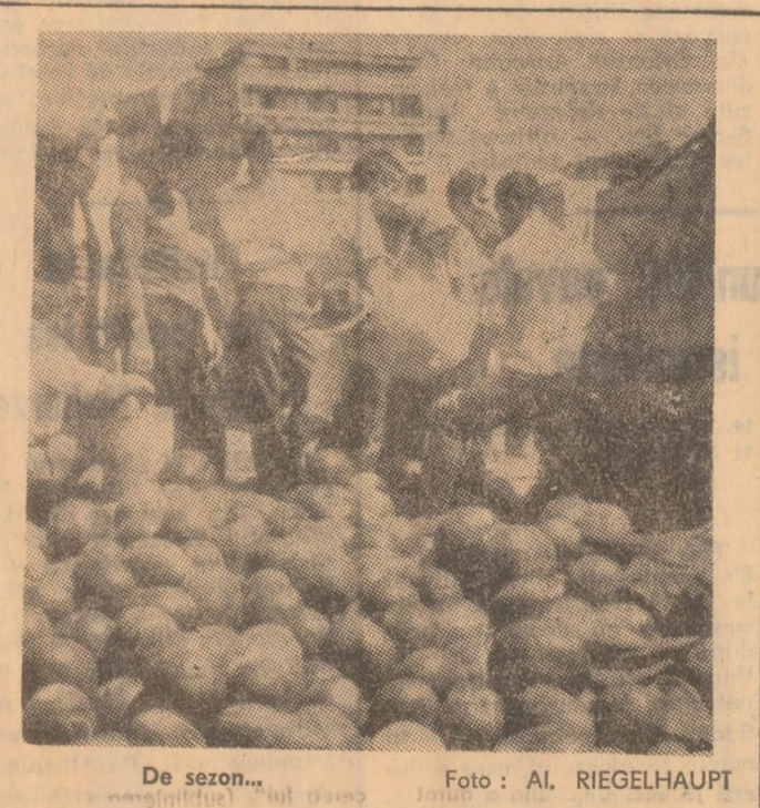
De sezon...