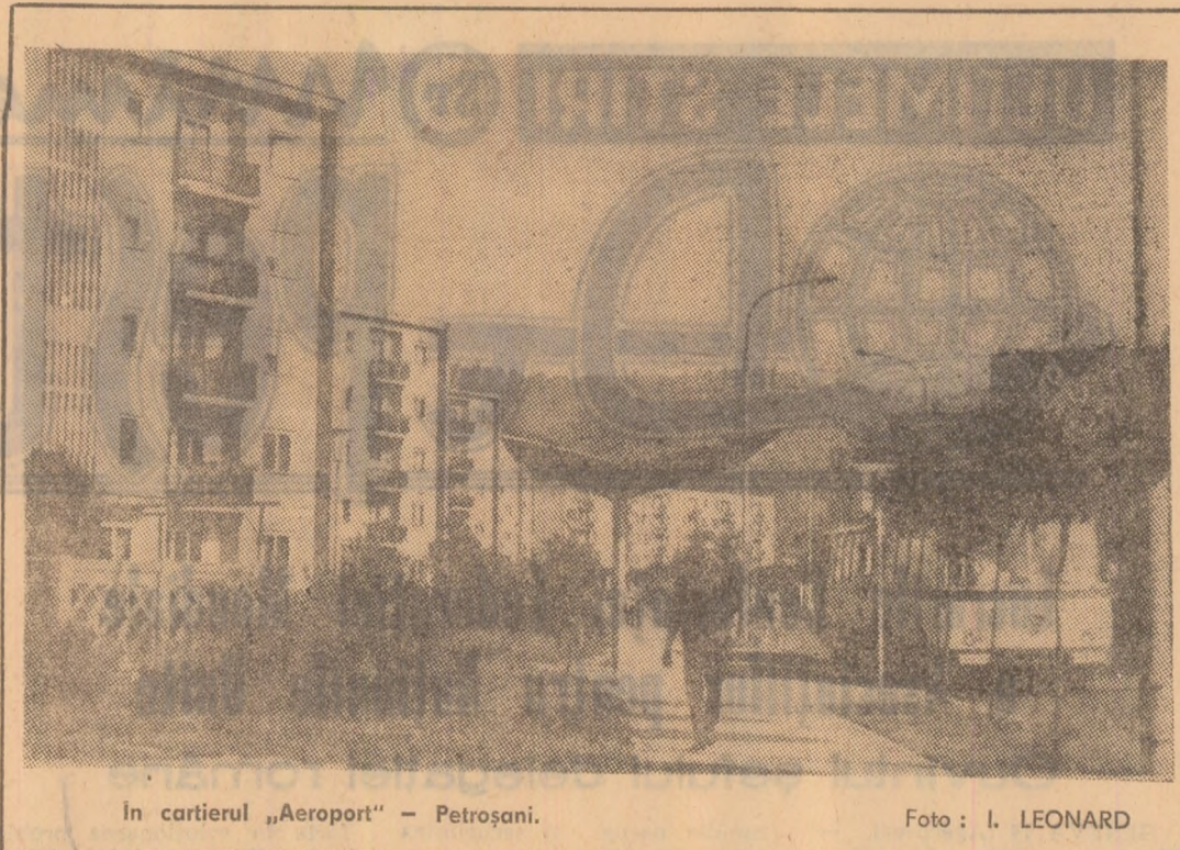
În cartierul „Aeroport” — Petroșani.

Nicolae NAPRODEANU, activist al Comitetului municipal U.T.C.