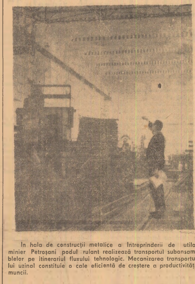
În hala de construcții metalice a întreprinderii de utilaj minier Petroșani podul rulant realizează transportul subsanșlelor pe itinerariul fluxului tehnologic. Mecanizarea transportului uzinal constituie o cale eficientă de creștere a productivității muncii.