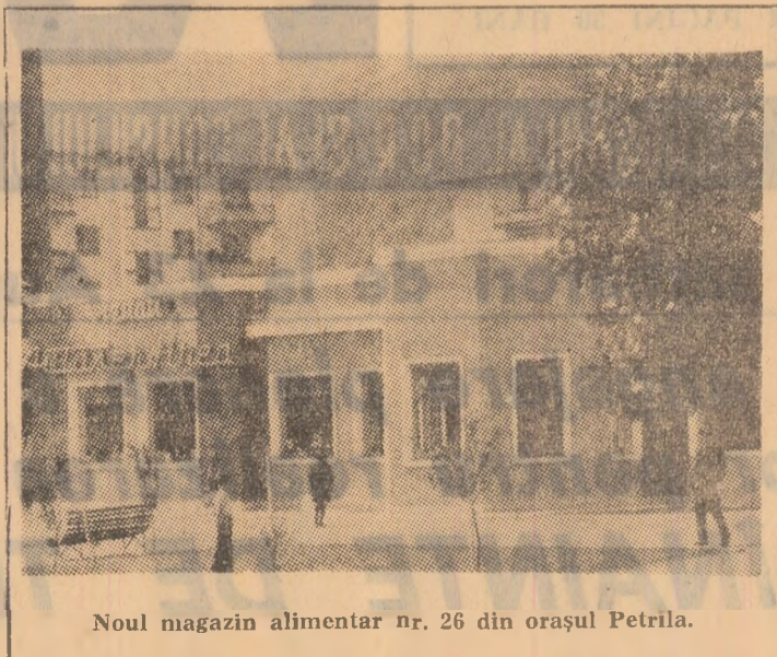
Noul magazin alimentar nr. 26 din orașul Petrița.

S-au amenajat, de asemenea, un nou complex al cooperatiei meșteșugărești, o nouă braserie, iar în curs de construcție se află un laborator de cofetărie.