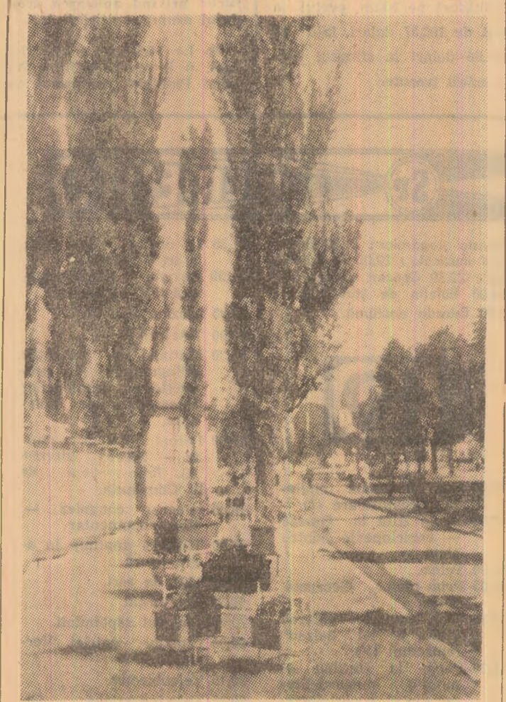
Noua fațadă a stadionului „Jiu”.

Prezent, la adunarea reprezentanților oamenilor muncii a atras atenția organului colectiv de conducere asupra faptului că redosarea producției, asigurarea îndeplinirii sarcinilor de plan pe cel de-al doilea semestru al anului și pe anul 1974, impun luarea celor mai severe măsuri în scopul realizării integrale a planului de pregătire, pentru asigurarea liniei de front active, organizarea corespunzătoare a producției și a muncii astfel ca, atît exploatarea cît și fiecare sector și brigadă, să-și realizeze planul minei.