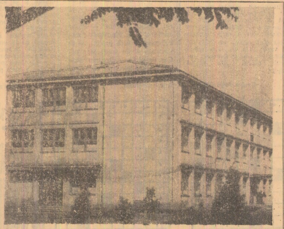
Școala nr. 4 Vulcan așteaptă oaspeții, pregătită din toate punctele de vedere.