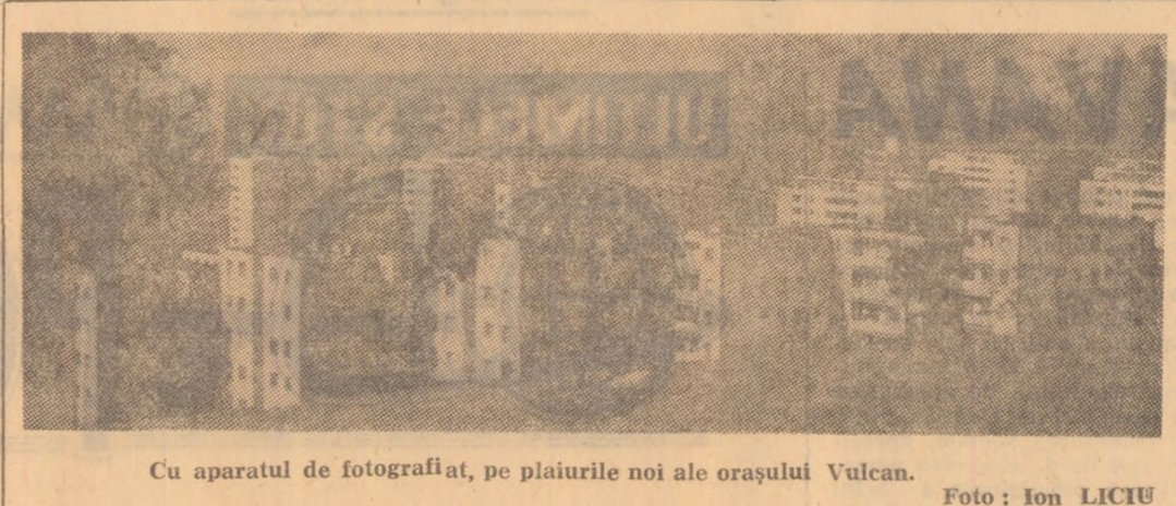
Cu aparatul de fotografiat, pe plaiurile noi ale orașului Vulcan.

Deși obosiți, totuși, voia bună, veselia au însoțit grupul pe la despărțire în gara Petroșani. Dumitru CORNEA, activist al Consiliului municipal al Organizației Pionierilor Petroșani