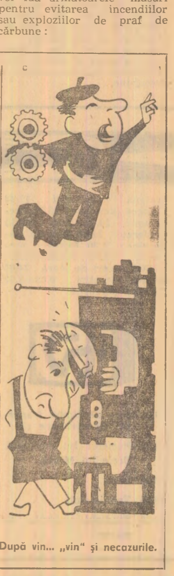
După vin... „vin” și necozurile.

situate la o înălțime sub 2,5 metri deasupra pardoselii sînt permise numai după opritarea acestuia. La executarea lucrărilor de sudură sau tăiere a metalelor în hala de uscare din uzinele de preparare a cărbunelui se vor lua următoarele măsuri pentru evitarea incendiilor sau exploziilor de praf de cărbune: