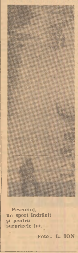
Pescuitul, un sport îndrăgit și pentru surprizele lui.

sesizarea cumpărătorului a fost soluționată pe loc, am considerat că avertizarea verbală și preluarea articolului cu tot colectivul unității este, deocamdată, deajuns, ca în viitor asemenea practici să nu se mai repete”. În urma publicării acestui articol, Consiliul municipal al sindicatelor Petroșani ne-a răspuns următoarele: „organul nostru a constituit un colectiv din activiști salariați și obștești, medici, cu ajutorul cărora s-au întreprins acțiuni de analiză la unitățile economice, asupra modului cum se acordă asistența medicală sa-