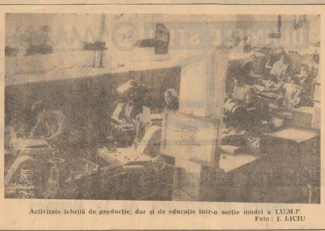
Activitate febrilă de producție, dar și de educație într-o secție model a I.U.M.P.