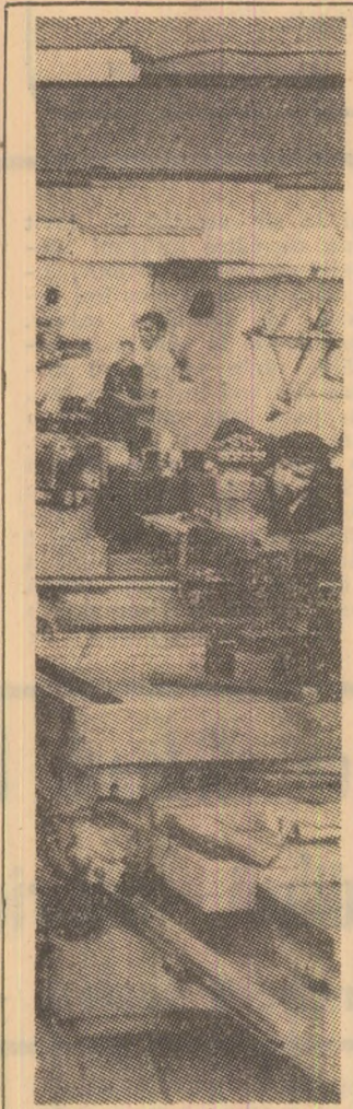
Cadru din sala de strînguri a F.S.H. Vulcan.