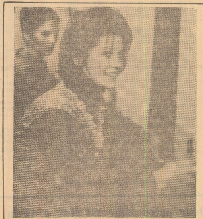
Țesătoare și gherghefuri.