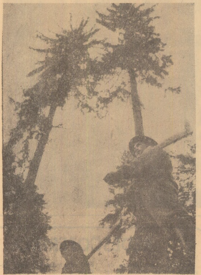
Incepe o nouă zi de lucru.

Ing. Bujor BOGDAN (Continuare în pag. a 3-a)