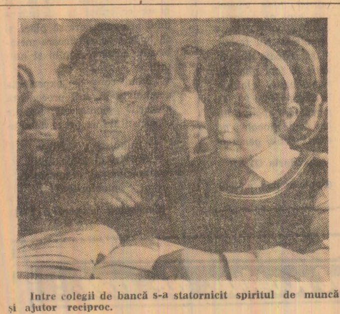
Între colegii de bancă s-a statornicit spiritul de muncă și ajutor reciproc.

de prioritate stabilită, în 15 zile de la afișarea listei, la comitetul executiv al consiliului popular respectiv, care va trebui să rezolve în cel mult 30 zile de la înregistrare. Legea autorizează C.E.C.-ul să acorde credite și pentru constituirea avansului, pe termen de cel mult 5 ani, cît și pentru acoperirea costului integral al locuinței în vederea contractării acesteia, pentru un termen de cel mult 10 ani cazuri în care dobînda anuală este de 8 la sută. În vederea aplicării Legii nr. 4/1973, Consiliul de Miniștri, a emis Hotărîrea nr. 880 din 20 iulie 1973, care prin art. 11 stabilește modul în care va fi percepută dobînda pentru împrumuturile acordate de stat la data încheierii contractului, în raport de salariul tarifar lunar, pensia lunară sau venitul mediu brut lunar: (pînă la 1.500 lei: de la 1.500 — 2.000 lei și peste 2.000 lei se percepe 2 la sută și 3 la sută și, respectiv, 4 la sută anual). În cazul în care suma reprezentînd creditul depășește 50.000 lei, dobînda, indiferent de venitul, este de