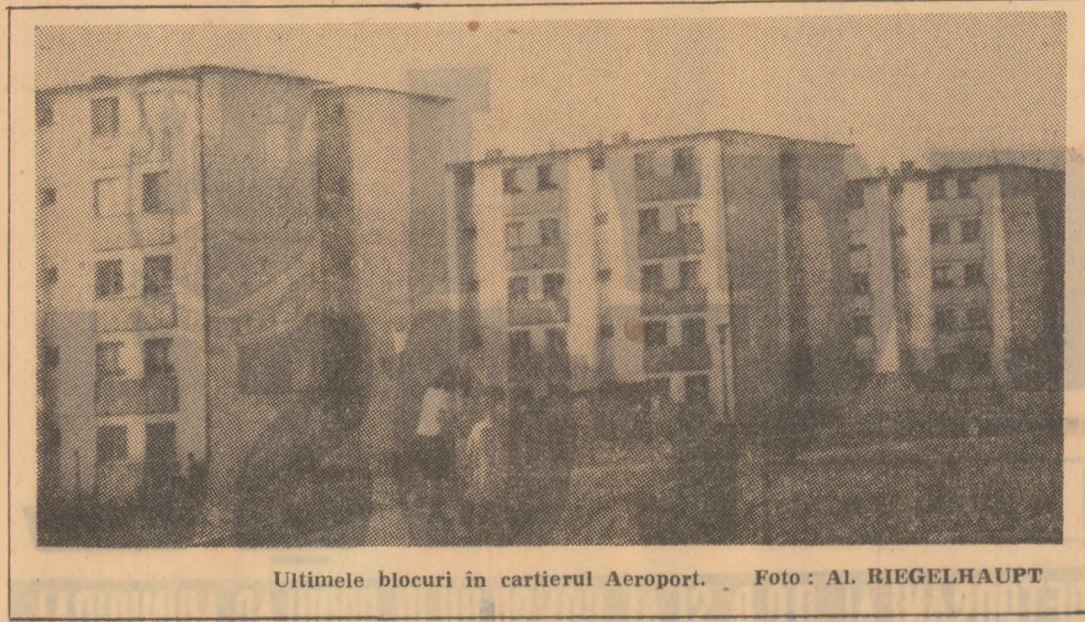
Ultimele blocuri în cartierul Aeroport.

Prof. Tiberiu GAGYI, activist al comitetului municipal U.T.C.