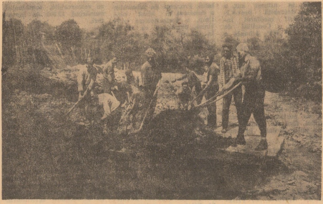
Un grup de cetățeni din Dilja Mare pregătind cimentul pentru lucrările de reparație la podul de peste piriul.