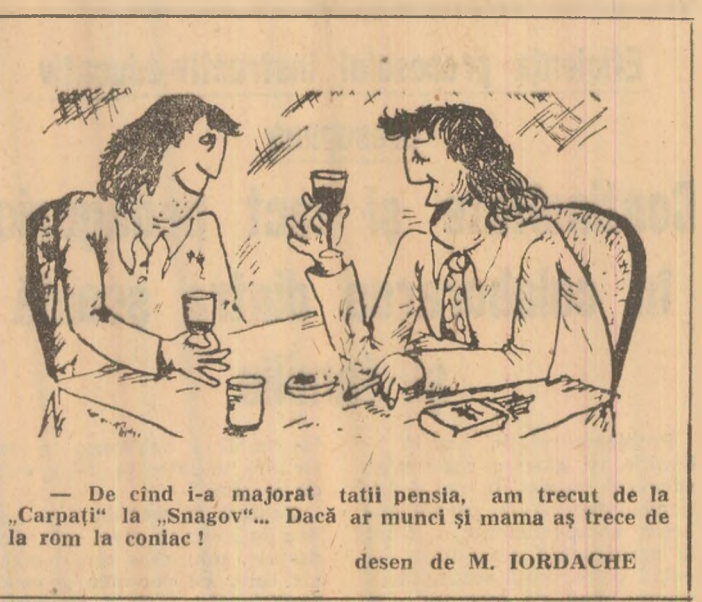
— De cînd i-a majorat tatii pensia, am trecut de la „Carpăți” la „Snagov”. Dacă ar munci și mama aș trece de la rom la coniac! desen de M. IORDACHE