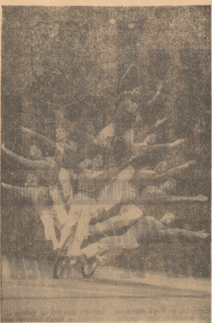
La Palatul Sporturilor de la Porte Veraille din Paris, au avut locu demult 14 reprezentații excepționale ale Circuitului de stat din Shanghai, R.P. Chineză. Numerele tradiționale au fost prezentate de cei 50 de membri ai trupei artistice, la un înalt nivel care a încântat numeroșii spectatori francezi.