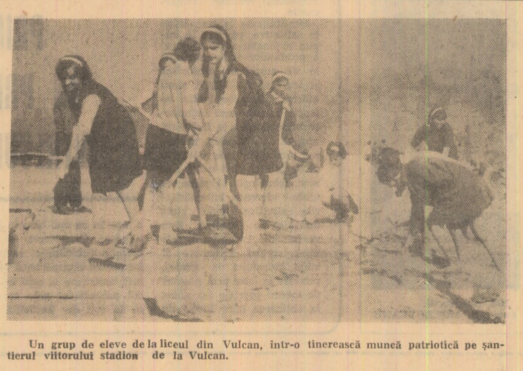
Un grup de elevi de la liceul din Vulcan, într-o tinerească muncă patriotică pe șantierul viitorului stadion de la Vulcan.