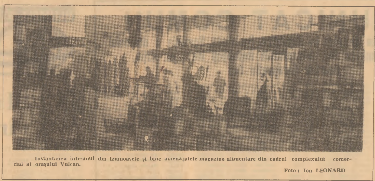
Instantaneu într-unul din frumosele și bine amenajatele magazine alimentare din cadrul complexului comercial al orașului Vulcan.

Tot mai multe organe și organizații de partid folosesc ca metodă de elaborare a planurilor de măsuri consultarea largă a comunistilor, a colectivelor de muncitori. Așa procedează comitetele de la I.U.M.P. și E.M. Lupeni. Aici se organizează sistematice discuții cu șefii de brigăzi, maștrii minieri și electromecanici, cu ceilalți muncitori, ingineri și tehnicieni pentru a se găsi soluții corespunzătoare în vederea realizării sarcinilor de plan.