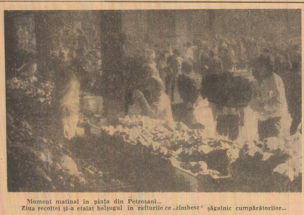
Moment matinal în piața din Petrosani... Ziua recoltei și-a etalat belșugul în rafturile ce „zimbesc” săgălnic cumpărătorilor...