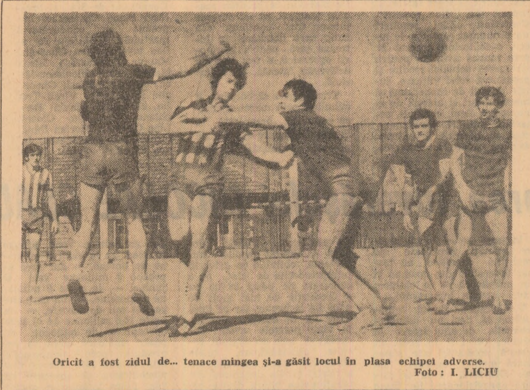
Oricit a fost zidul de... tenace mingea și-a găsit locul în plasa echipei adverse.