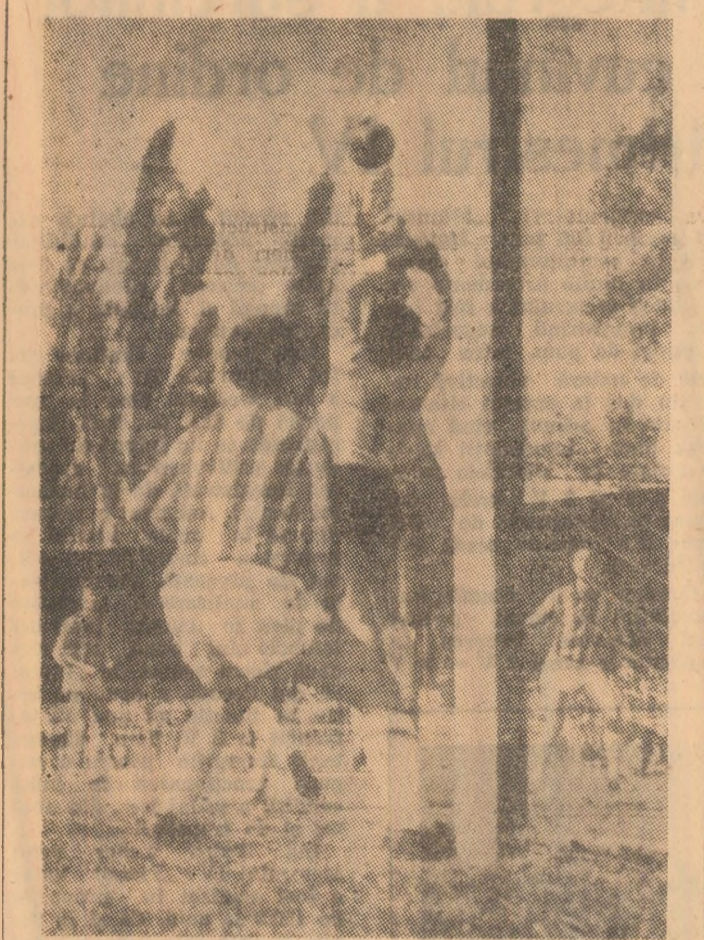
Cit p-aci să fie gol, dar...