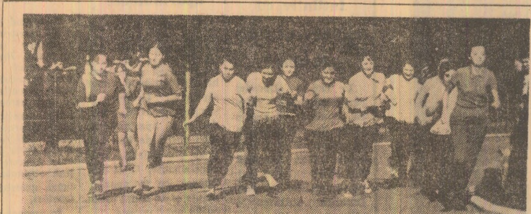
Aspect din timpul crosului.