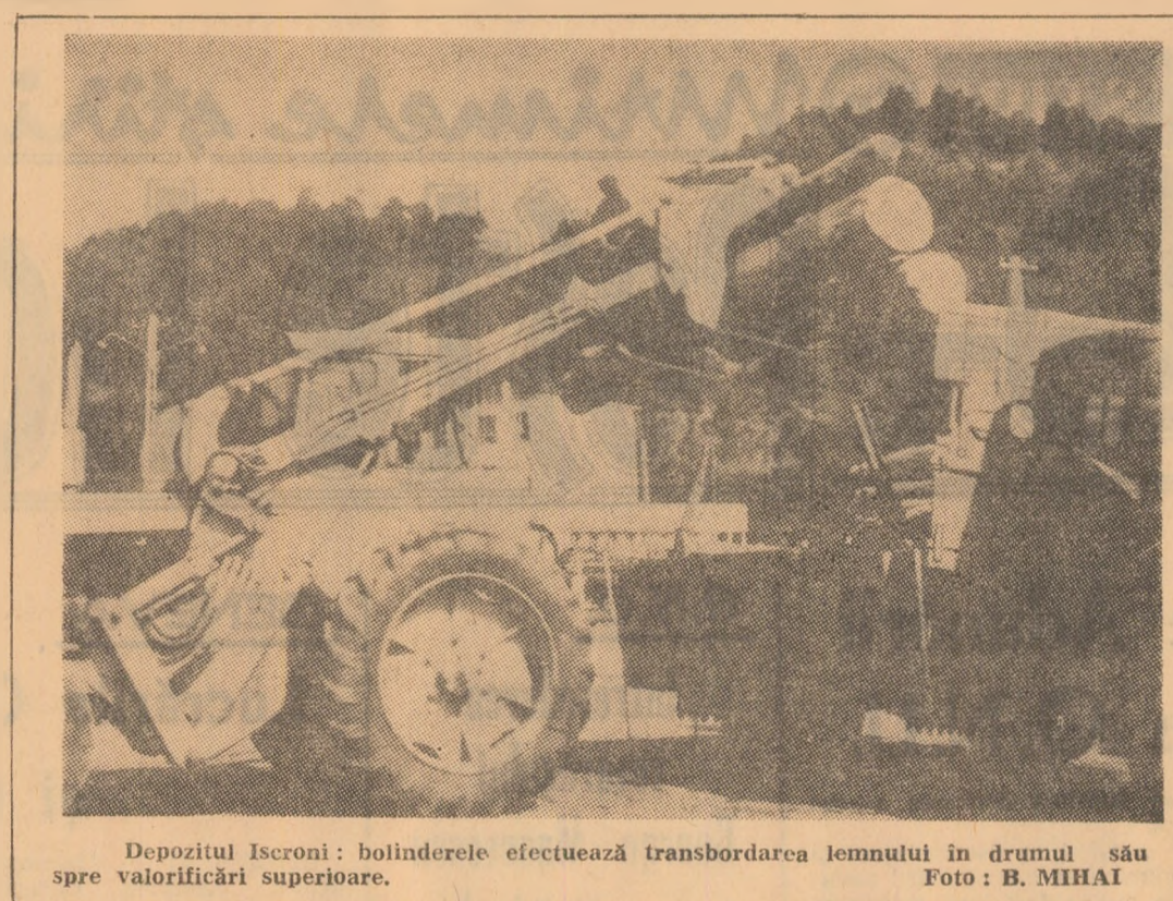
Depozitul Isroni: bolinderile efectuează transbordarea lemnului în drumul său spre valorificări superioare.