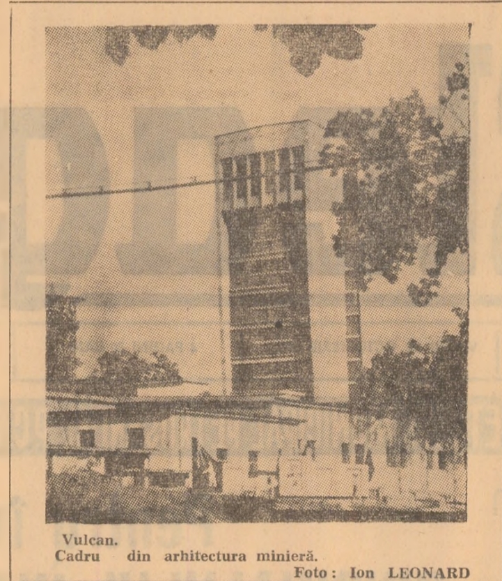
Vulcan. Cadru din arhitectura minieră.

nijă am continuat, iar M-a ajutat foarte mult. De fapt, după școală, în clasa a II-a, tovarășea învățădoare M. Voiculescu a venit să mă ajute să mă înscriu la cercul de arte plastice de la școala de muzică și