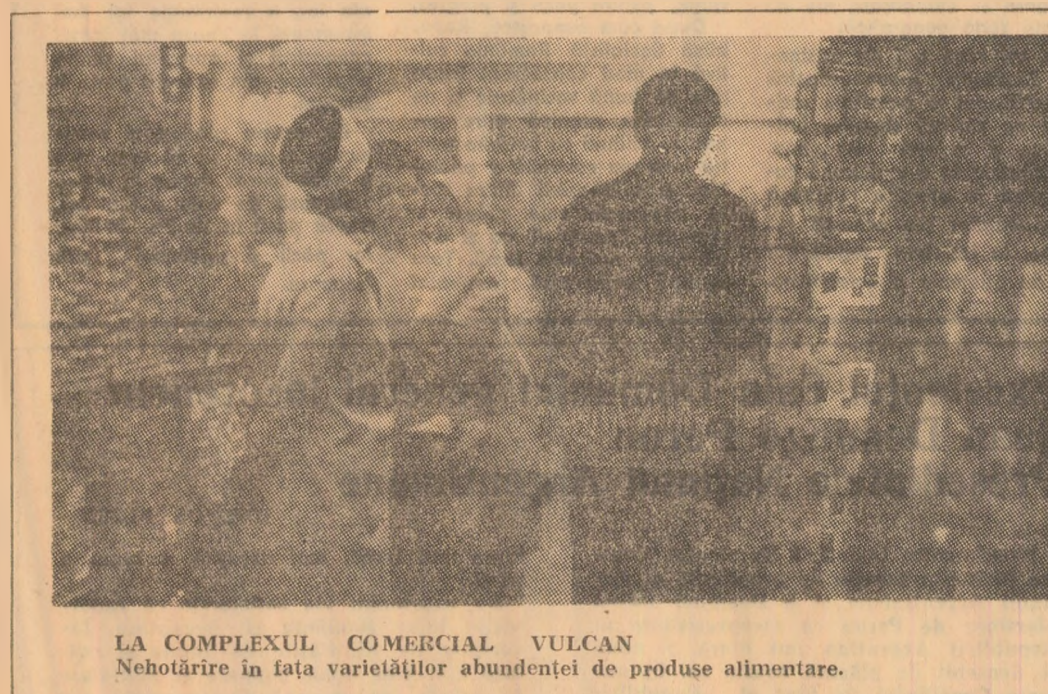
LA COMPLEXUL COMERCIAL VULCAN. Nehotărîre în fața varietăților abundenței de produse alimentare.

● O veste bună pentru autoșcolarii. Pe șoseaua Cristian, la ieșirea din Brașov, a fost dată în exploatare o modernă stație de întreținere și reparatii auto, fiind dotată cu toate cele necesare efectuării de reparații la orice tip de autovehicule. ● La pepiniera de la Turia, județul Covasna, au fost întreprinse cercetări în domeniul creșterii eficienței economice a culturilor de puieți de rășinoase. Culturile intensive din „solarii” se dezvoltă cu o rapiditate de două ori și jumătate mai mare decît cele de pepinieră. Așa se face că puieții cultivați de plantătoare vor fi buni de plantat încă în luna februarie anul viitor. O experiență interesantă a fost făcută cu noua specie de „pin Berekșiana” — originară din America de Nord, care va fi acclimatizată în zona Tg. Secuiesc. ● 100 000 de flori recoltate — iată o cifră record obținută într-o singură zi — cea mai mare de pînă acum — la Întreprinderea de sere din Codlea. Garoafele de aici se bucură de o bună apreciere și peste hotare. La recentul concurs internațional al florilor de la Hamburg, la care au participat peste 580 de firme renumite din toată lumea, garoafele românești au obținut o medalie de argint și șapte de bronz. (Agerpres)