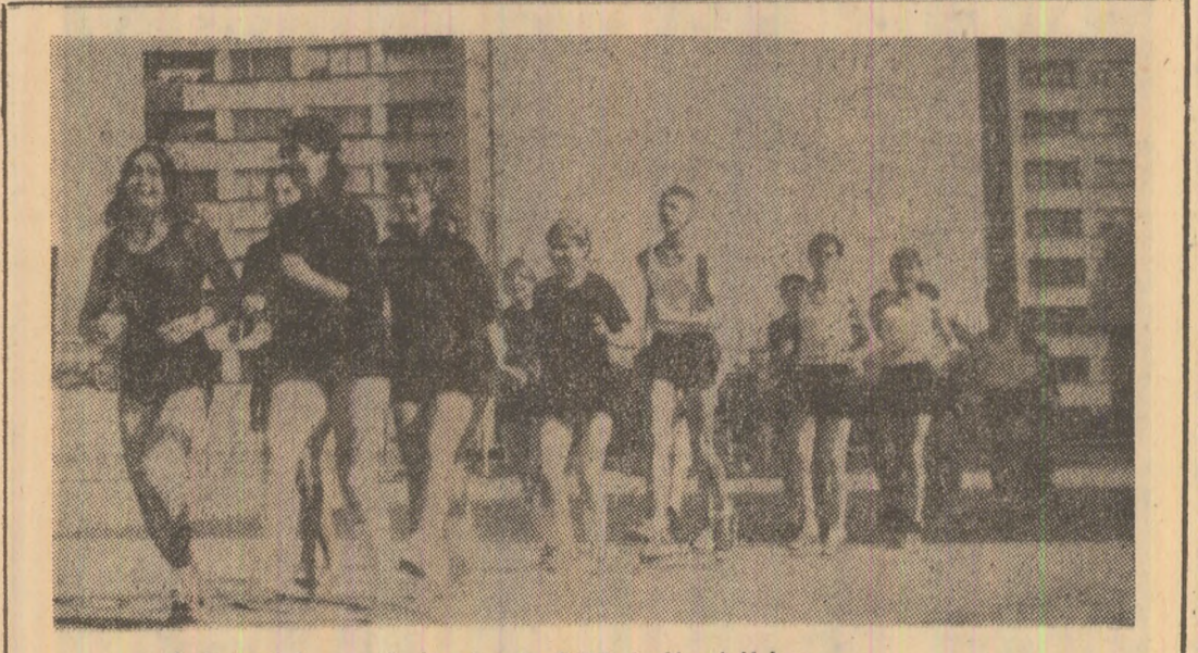
„Inviore” la o oră de educație fizică, la Liceul Vulcan...