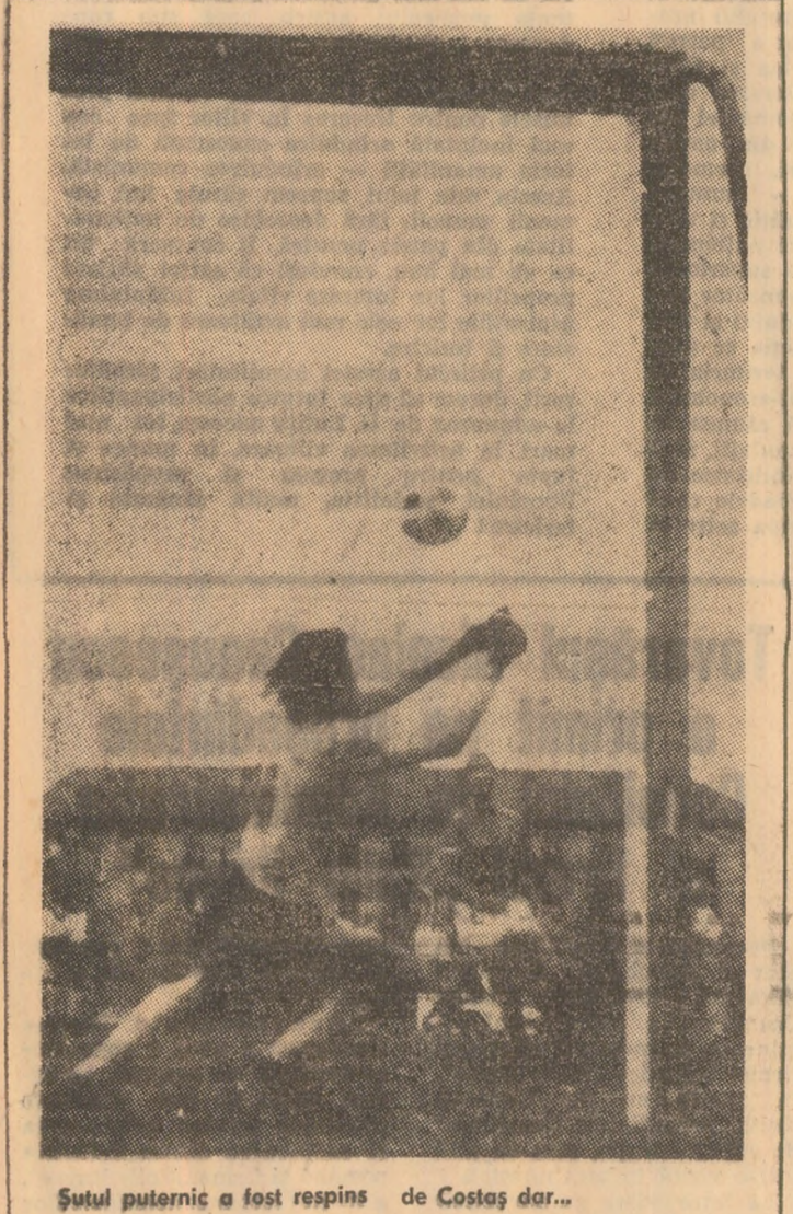
Sutul puternic a fost respins de Costas dar...