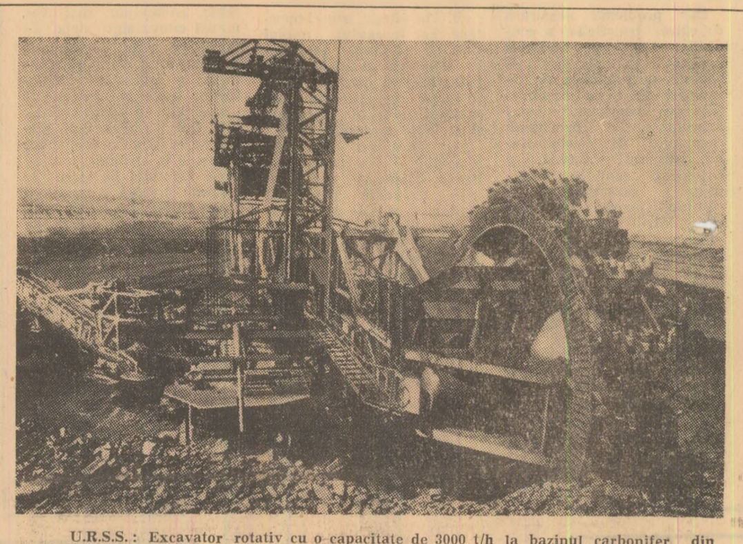
U.R.S.S.: Excavator rotativ cu o capacitate de 3000 t/h la bazinul carbonifer din Kazahstan.

AMMAN 22 (Agerpres). — „Guvernul Regatului hasemit al Iordaniei a acceptat hotărârea Consiliului de Securitate privind încetarea focului în Orientul Apropiat și reafirmă necesitatea aplicării rezoluției 242 din 22 noiembrie 1967” — a declarat luni seară, Zeid Rifai, premierul iordanian.