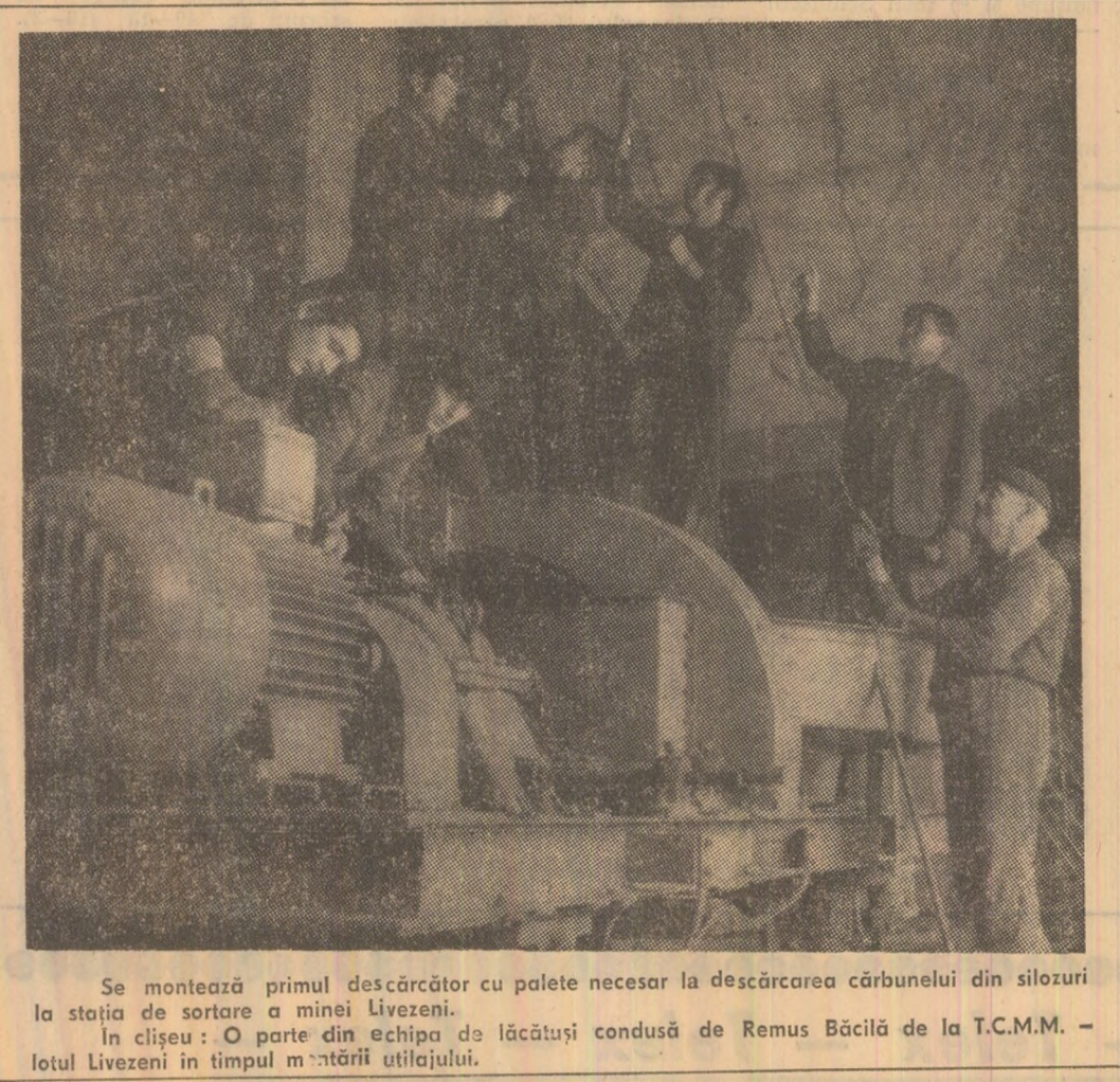
Se montează primul descărcător cu palete necesar la descărcarea cărbunelui din silozuri la stația de sortare a minei Livezeni.