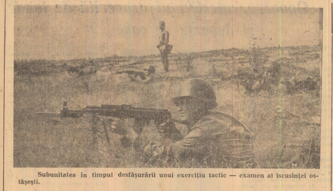
Subunitatea în timpul desfășurării unui exercițiu tactic — examen al iscusinței ostașești.

C a un brîu viu înconjurînd țara, la hotare, prezintă lor e un simbol al tăriei acestui țărîm de vise și împliniri. Chipul lor e însuși chipul nostru, e însuși chipul țării, căci ei vin cu noi din istorie și trec în istorie, spre slava unui brav și demn popor. Sîndu-și răspunderile, ei își forțează încredințarea de luptă și virtuțile morale prin muncă plină de patos pe cîmpurile de instrucție și de aplicație bătătorite de ritmul pașilor neobosiți, răspund prezent pe șantier unde, alături de oamenii muncii, împlinesc idealuri solare în geometria de oțel și de beton, boltind în geografia socialistă a țării noi arcuri de triumf, tîind în cîmpii canale de irigații pentru a face transzumie de rodnice pămîntului însetat de apă. Iar în toamnele îndulcite de arome de struguri și ionatane, minile lor adună bob cu bob fertilitatea gleei. Pretutindeni prezenți, ostașii veghează sușul țării pe verticalele viitorului comunist și faurire, umăr la umăr cu poporul, lucrării noi pe fruntea României.