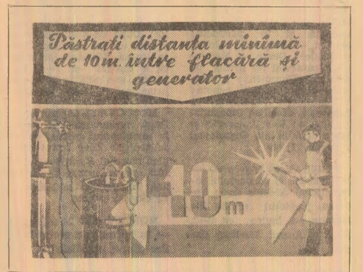
Pastrati distanța minimă de 10m între flacăra și generator

Executarea reparațiilor în siloz se va face numai după completarea evacuării materialului și numai de pe poduri sau schele care să asigure securitatea celor ce efectuează aceste lucrări. De la caz la caz, unele reparații se vor putea executa și de pe vîntul materialului în silozul înalt numai cu aprobarea șefului instalației de preparare și cu prevederi suplimentare de protecție.