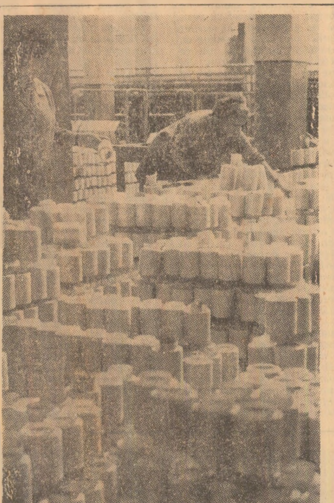
I.F.A. VISCOZA Pîntre kilometri de mătase...

Convorbire consensată de Lt.-colonel Nicolae POP (Continuare în pag. a 2-a)