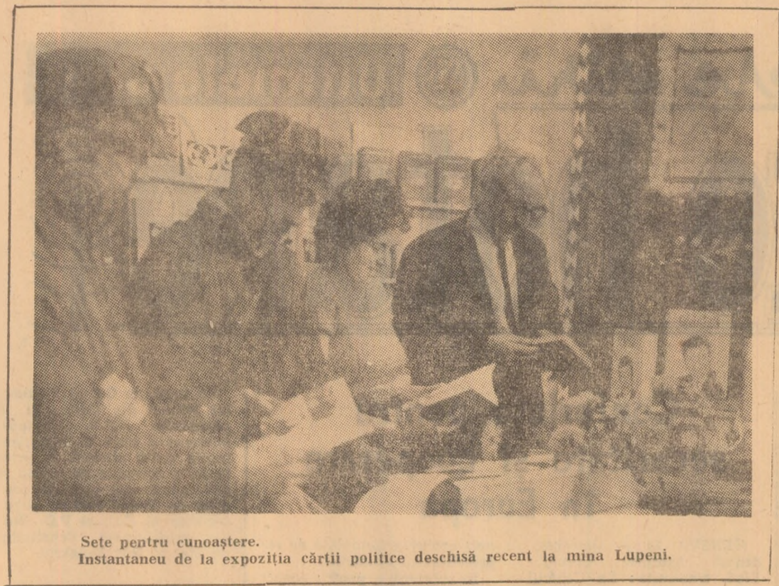
Sete pentru cunoaștere. Instantaneu de la expoziția cărții politice deschisă recent la mina Lupeni.

— Cu sentimentul mîndriei că, alături de ceilalți ostași români, umăr la umăr cu ostașii sovietici, regimentul de sub comanda mea și-a adus contribuția activă la eliberarea patriei de sub jugul fascist, la dobîndirea victoriei asupra crudului dușman. Cu sentimentul imensei bucurii că jertfa celor căzuți pe cîmpul de bătălie n-a fost zadarnică, robind o viață nouă, luminoasă pe pămîntul României. Cu sentimentul marelui încrederi în ostașul român de azi, chemat să continue glorioasele tradiții de luptă ale înaintașilor, să vegheze cu bărbăție și demnitate spre străbună, sușul patriei spre culmile viitorului ei de aur.