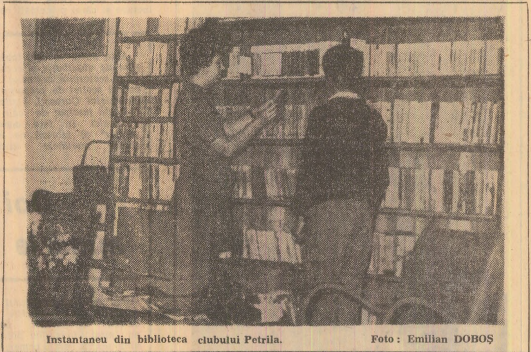
Instantaneu din biblioteca clubului Petrița.

Clubul sindicatelor din orașul Petrița atrage zilnic un număr tot mai mare de tineri și vîrstnici. Mai ales acum, cînd anotimpul friguros se instalează pe zi ce trece. Biblioteca clubului dispune de 16.822 volume și este continuu îmbogățită cu cărțile noi sau retipărite. Numărul cititorilor, în prezent de 1151, este în continuă creștere. De la începutul anului au fost citite 6964 cărți literare, politice și tehnice. Pentru popularizarea cărților au fost organizate cu regularitate diferite acțiuni și manifestări ca: recenzii, ghicitori literare, seri de poezie, expoziții, prezentări, diferite conferințe privind dreptul, echitatea, normele de conviețuire în societate, dezvoltarea industriei mineritului, cele mai noi cercuiri în tehnica minieră, acțiuni la care au luat parte un mare număr de auditori. În cadrul clubului sînt amenajate de asemenea, săli de șah, zilnic la dispoziția minerilor, care nu sînt deloc puțini la număr, iar pe tărîm artistic, clubul a atras multe talente care activează în diferite formații artistice.