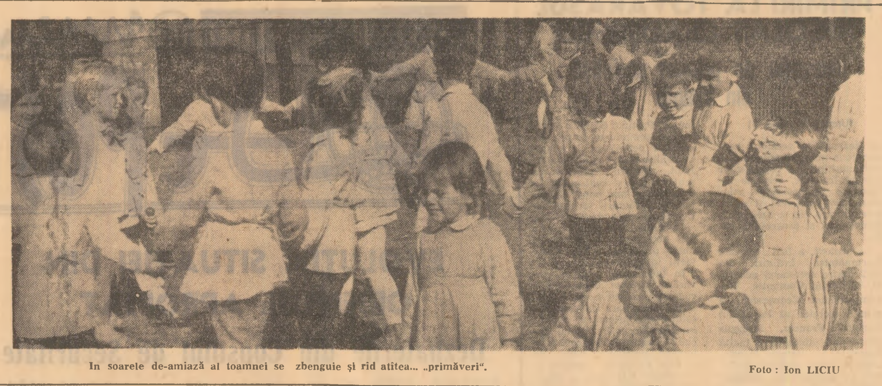
În soarele de-amiază al toamnei se zbuguie și rid atitea... „primăveri”.

ținerea a doi responsabili la magazin. Este vorba de o aplicare greșită a prevederilor Decretului nr. 162/1973, deci de o eludare a legii de către conducerea întreprinderii. Un fel de „compromis” între conducere și cei doi responsabili, care a declanșat o serie de alte abateri (compromisuri) ale responsabililor despre care conducerea întreprinderii avea sau nu avea cunoștință. Intre acestea din urmă se înscrie și abaterea privind utilizarea casierii Delioranu pe un alt post. Ne surprinde „justificarea” adusă în folosul conducerii I.C.L.S.A., cum că schimba-