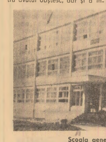
Școala generală nr. 6 din Petrla