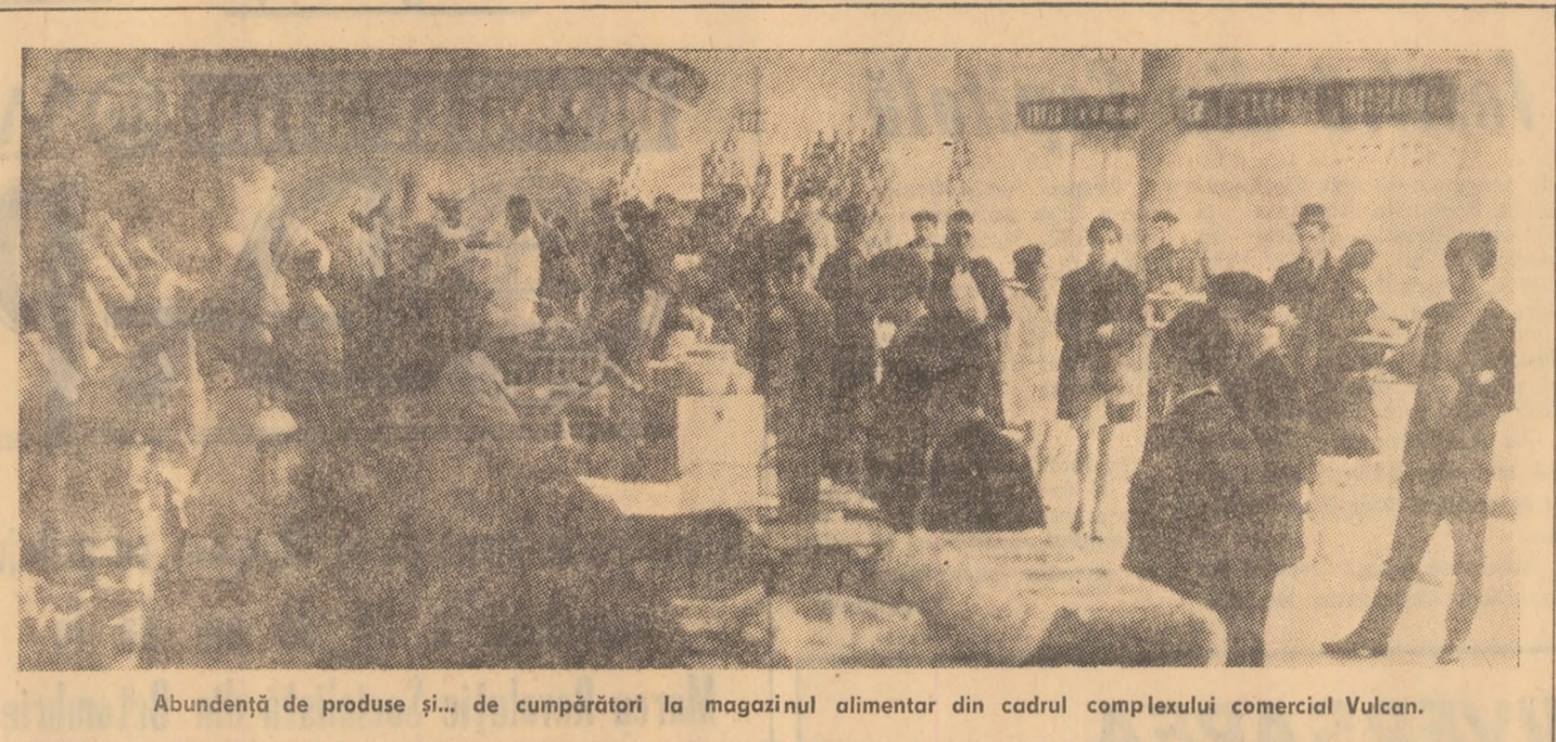
Abundență de produse și... de cumpărători la magazinul alimentară din cadrul complexului comercial Vulcan.