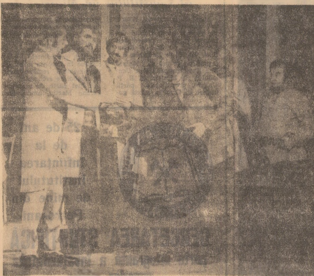
Instantaneu din spectacolul cu piesa „Fata fără zestre” de N. Ostrovski.

Cifra textului, regizorul, în mod firesc, se află într-o dilemă: va monta piesa într-o concepție „clasică” sau într-una „modernă”? De fapt, ce ne spun cei doi termeni — „clasic și modern”? Deoarece acum, după aproape o sută de ani, piesa la o simplă lectură, ne spune nouă altceva decât citorulul sau spectacolul de atunci! Prin urmare problema clasic — modern are o