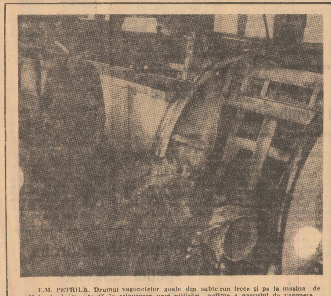
E.M. PETRILA. Drumul vagonetelor goale din subteran trece și pe la mașina de curățat, etapă importantă în asigurarea unei utilizări optime a parcului de vagoane.