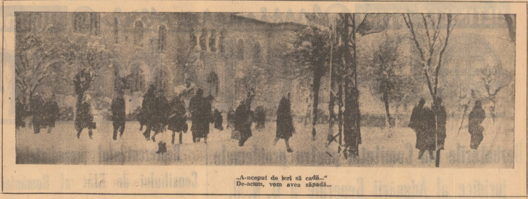
„A-nceput de ieri să cadă...” De-acum, vom avea zăpadă...