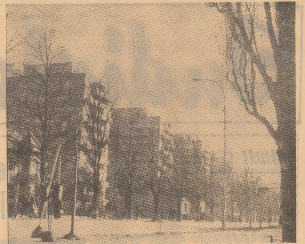
Strada principală a Petrosaniului în... (înută nouă).

Recordul minei Lupeni a fost precedat de realizări mereu ascendente, obținute ca urmare a măsurilor judicioase de organizare a producției și a muncii luate de către conducerea minei. Aceste măsuri de ansamblu au fost susținute printr-o vie mobilizare a minerilor, inginerilor, maștrilor și tehnicienilor minei, în frunte cu comunistii, care participă tot mai plener la îndeplinirea dezeratului întregului colectiv — SPORIREA PRODUCȚIEI DE CĂRBUNE, DEPĂȘIREA SARCINILOR DE PLAN PE MĂSURA BOGATELOR TRADIȚII DE MUNCĂ ALE LUPENIULUI.