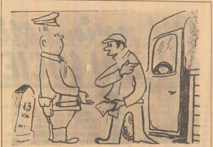
— Tovarășe milițian, nu sîntei de acord că, dacă circula cu camionul gol, consum mai puțină benzină?!

nile arzînd și nu m-a lăsat inima să tac, vîzînd cît de bine înțeleg unii să-și facă datoria. Ne bucură atitudinea plină de responsabilitate a celor doi oameni care nu pot trece nepăsători pe lângă risipă. Și sperăm, în același timp, că cei ce aveau sarcina deloc obositoare de a acționa un intrerupător în momentul ivirii zorilor vor înțelege ceva din lecția celor două telefoane.