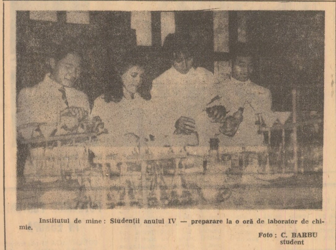
Institutul de mine: Studenții anului IV — preparare la o oră de laborator de chimie.

ționalitate legate de activitățile tehnico-economice și sociale specifice unităților productive din Valea Jiului și celelalte bazine miniere din țara noastră. Fără îndoială că tradițiile bine cunoscute ale cercetării științifice universitare, preocupările tot mai sustinute ale cadrelor de specialiști din unitățile productive orientate spre adoptarea unor soluții tehnice menite să asigure optimizarea tehnologiilor de lucru vor primi cu acest prilej o nouă confirmare prin prezentarea unor lucrări de înalt nivel științific, elaborate de reușiți specialiști. Urăm mult succes tuturor participanților la această valoroasă manifestare științifică care reprezintă un eveniment remarcabil în tehnica minieră din țara noastră!