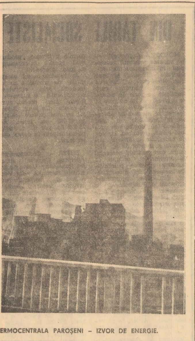
TERMOCENTRALA PAROSENI - IZVOR DE ENERGIE.