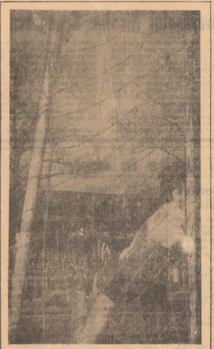
Șutul lui Roznai l-a „ingenuncheat“ pe Iordache, 1-0...