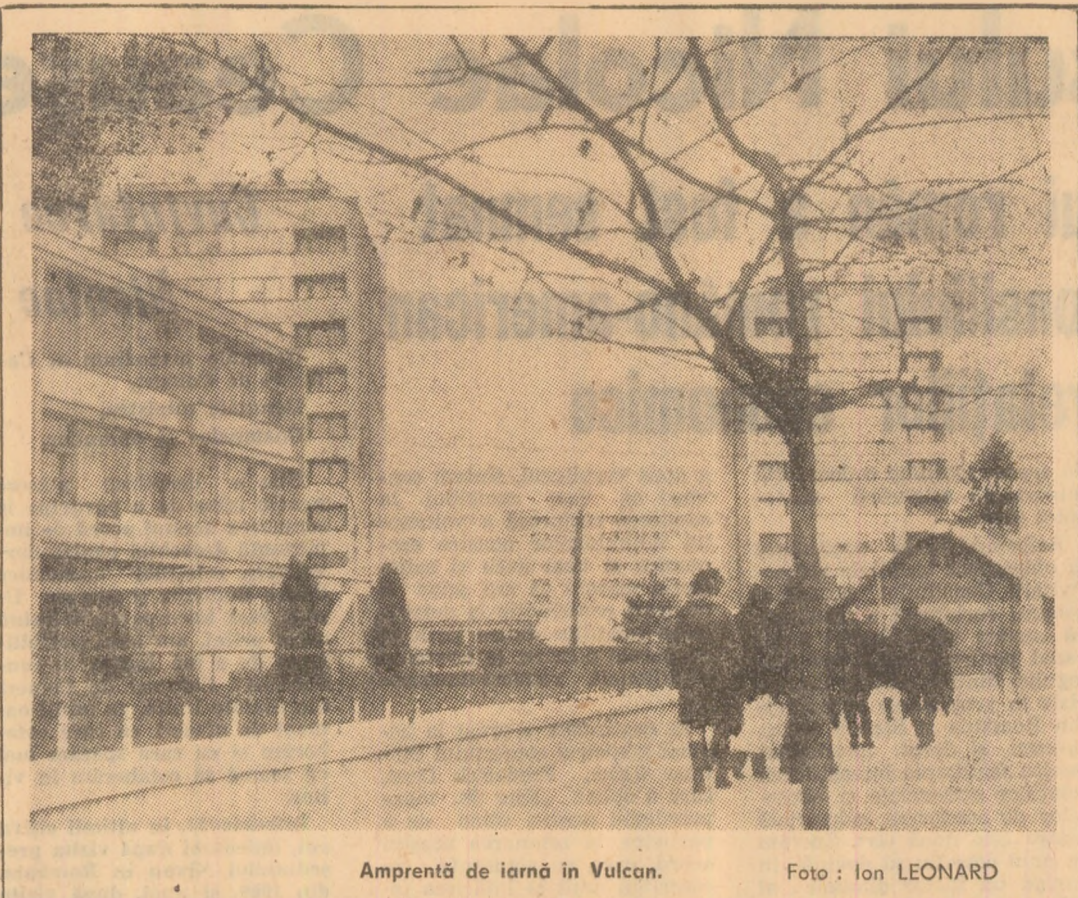
Amprentă de iarnă în Vulcan.