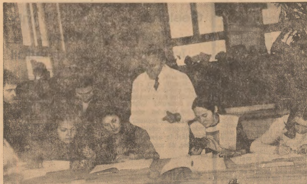
Sub îndrumarea șefului de lucrări Nicolae Ungureanu, studenții anului I exploatari își sistematizează cunoștințele de mineralogie acumulate pe parcursul primului semestru. O repetiție generală înainte de sesiunea de examene.