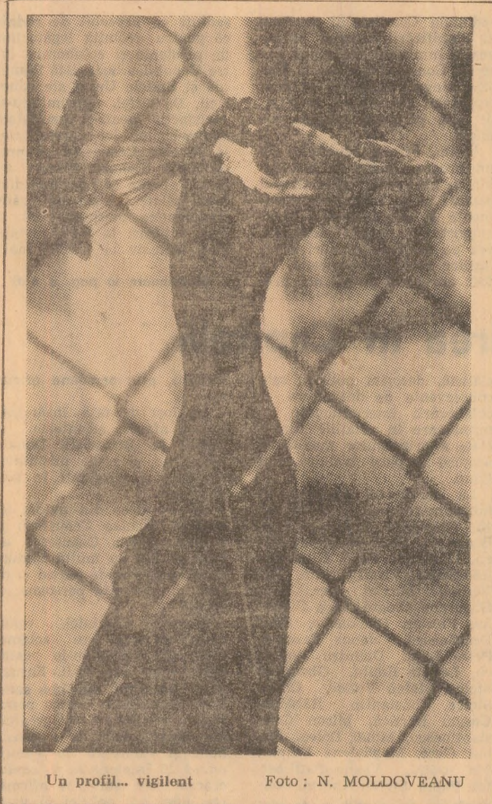
Un profil... vigilant