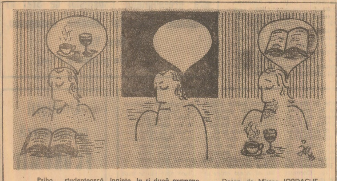
Psiho... studentească înainte, la și după examene. Desen de Mircea IORDACHE

de locuri. La subsoalul clădirii de patru etaje a muzeului, situată în centrul Madridului, va fi amenajată o instalație de climă artificială pentru a proteja tablourile, care au de suferit de pe urma poluării atmosferice.