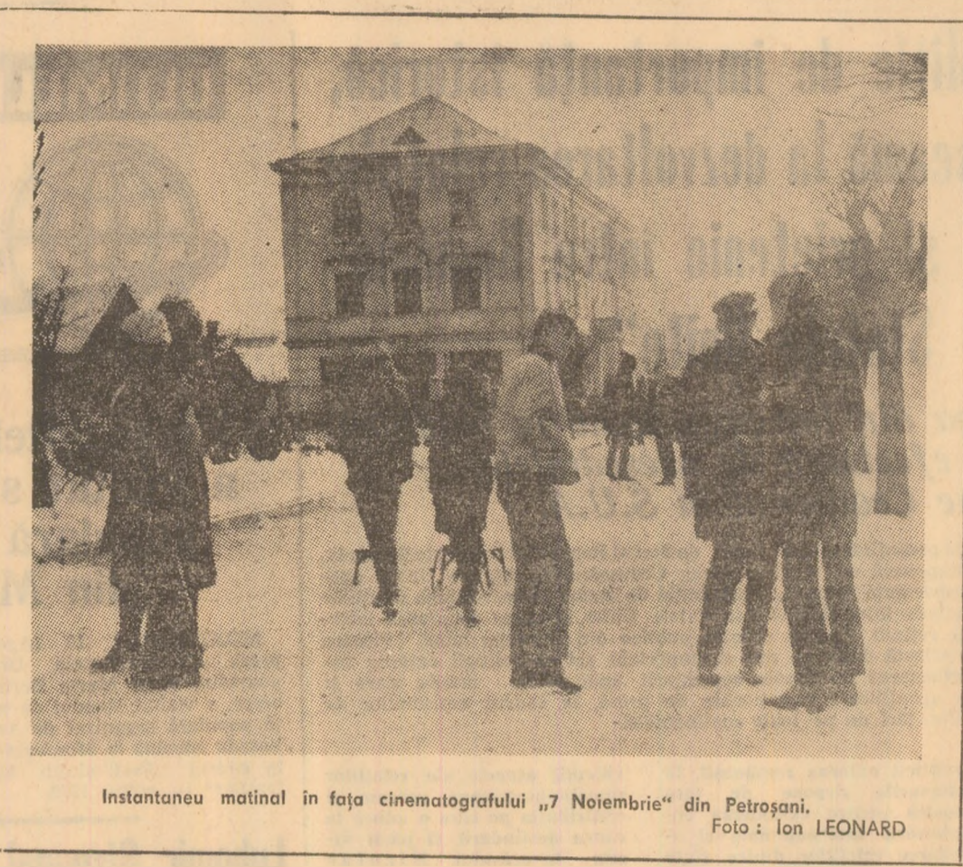
Instantaneu matinal în fața cinematografului „7 Noiembrie” din Petroșani.