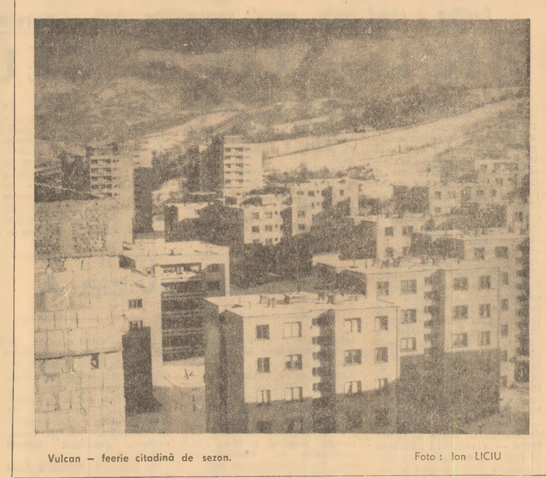
Vulcan — feerie citadină de sezon.

secretarul comitetului de partid al minei Lonea — că am făcut pași importanți pe calea îmbunătățirii activității de partid. Rîndurile organizației s-au întărit, metodele și stilul de muncă au cunoscut un proces de continuă perfecționare, autoritatea și prestigiul organizațiilor de partid, ale comunistilor au crescut