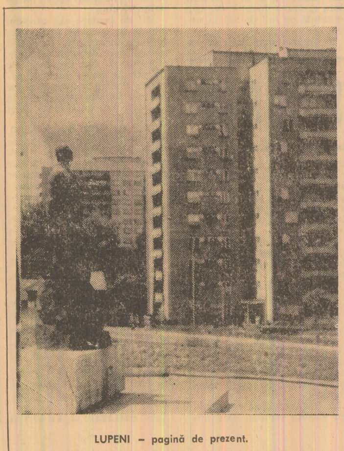
LUPENI - pagină de prezent.