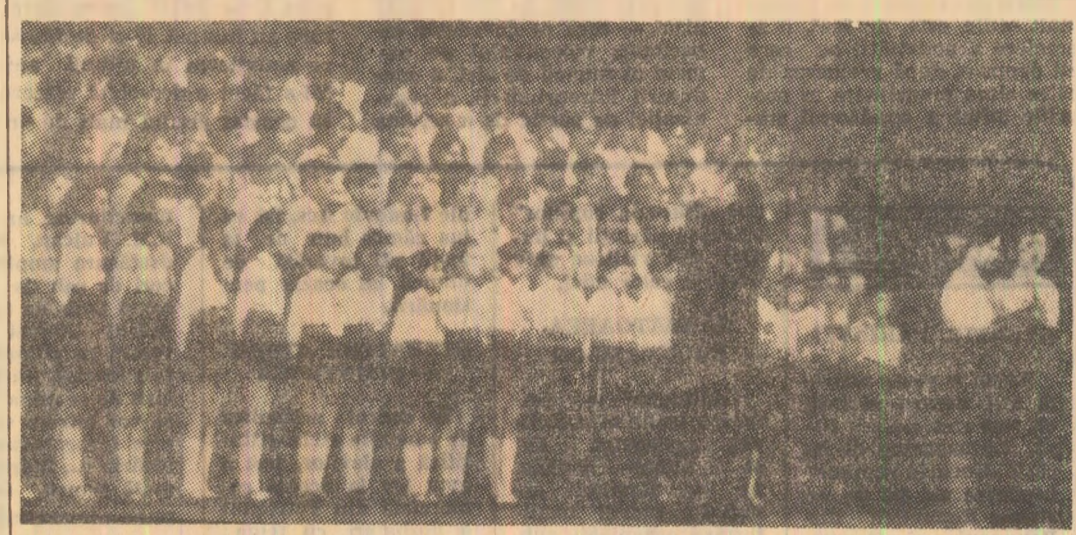
Corul „DOINA” al pionierilor de la Școala generală nr. 5 din Petrița.

prețul vieții lor, de aceea mulți se aflau alături de el, care intrase în ocnă din sfidare. Puterea, rezistența loanei îl împresionează profund și vizu-luare, iar rostul omului, al său, alt suport moral social. Romanul e pigmentat de momente lirice dar și de scene tari, antrenante, ce captivează cititorul, punîndu-i sensibilitatea inițial vibrată. In mare încercare: „Cînd Adina își asumă răspunderea crimei pe care credea că fratele său a comis-o. Dar în închisoare întîlneste altfel de oameni. comunistii, care-l impresionează printr-o atitudine de-o rară simplitate. Aceștia luptau cu