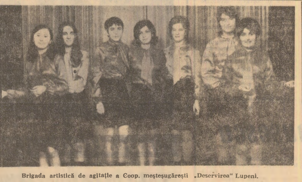
Brigada artistică de agitafle a Coop. meșteșugărești „Deservirea” Lupeni.

Clubul sindicatelor din Lupeni organizează astăzi la ora 18, ziua sectorului V al minei, Acțiunea face parte dintr-un ciclu de manifestări culturale-educative care contribuie, prin forme variate, la îmbunătățirea procesului de producție. De această dată este prezentă o masă rotundă cu lema „Metode și procedee avansate de prevenire a incendiilor la locul de muncă”. In continuare va fi susținut un spectacol de către formațiile artistice de amatori ale clubului și o seară de dans pentru mineri și familiile lor.