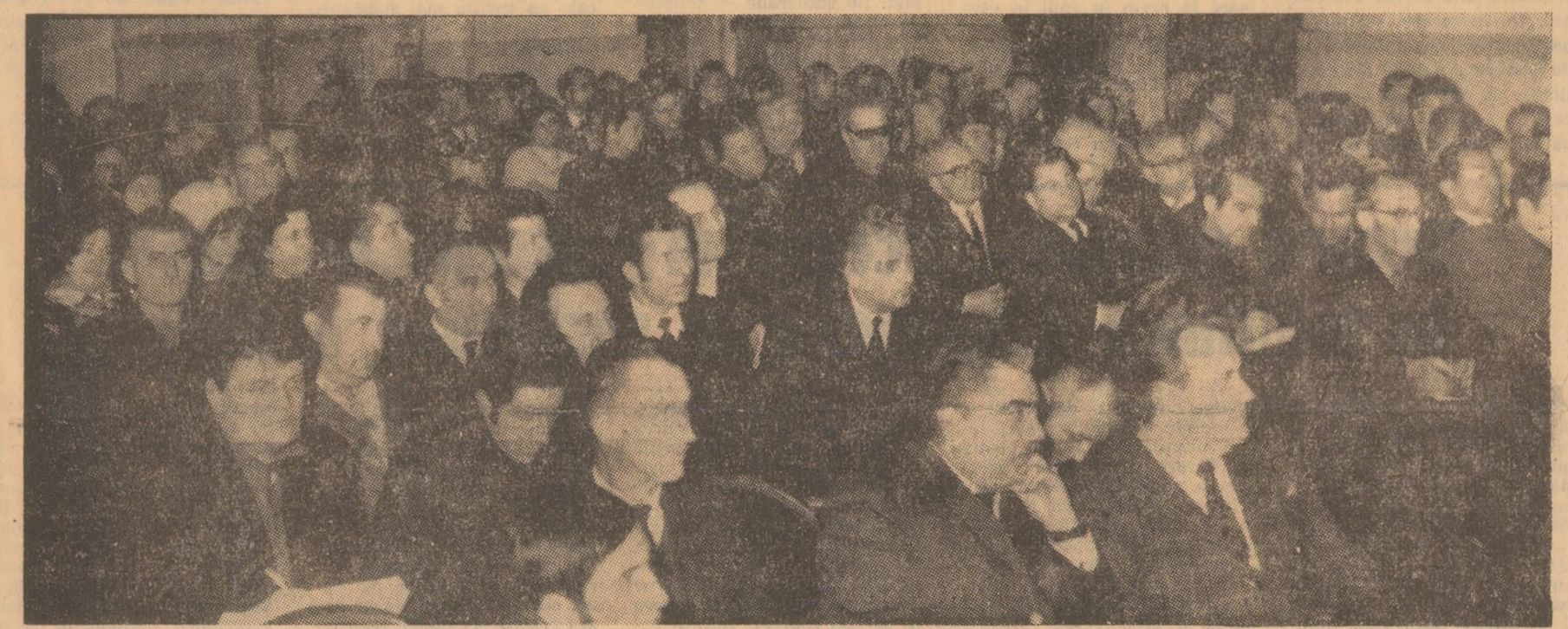
Aspect din sală în timpul adunării activului de partid.

(În pagina a 2-a relațări de la dezbaterile care au avut loc).