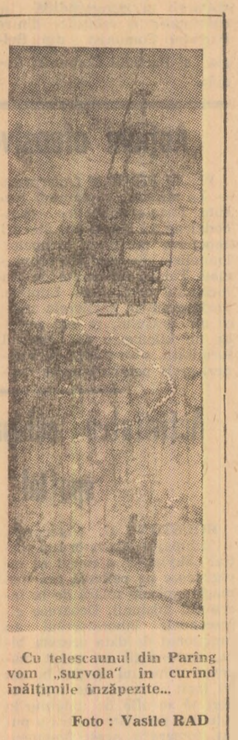
Cu telescoapul din Paring vom „survola” în curînd înălțimile înzăpezite...