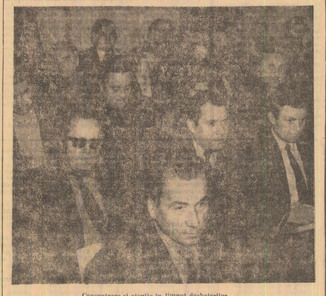
Concentrare și atenție în timpul dezbaterilor.