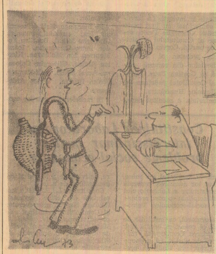
Dom' șef, hic... am venit... hic... cu „motivul” nemotivatului de ieri... hic...!